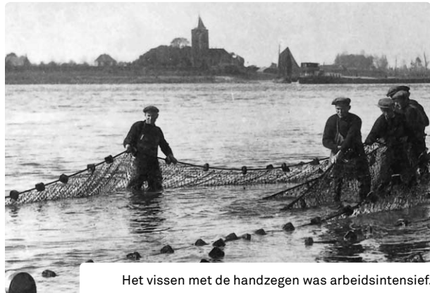
Het vissen met de handzegen was arbeidsintensief.

Eind januari 1884 klaagden de Brakelse vissers opnieuw over de slechte zalmvangsten. Na acht dagen waren ze gestopt met de zegenvisserij omdat er geen zalm was gevestigd en de 26 daaraan werkzame personen geen cent hadden verdiend. Begin 1885 moest de visserij worden gestopt vanwege het drijfjij. Op 29 januari kon de zalmvisserij worden hervat, maar de resultaten vielen tegen. Dat werd mede veroorzaakt door de hoge waterstanden ➤