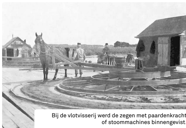
Bij de vlotvisserij werd de zegen met paardenkracht of stoommachines binnengevestigd.