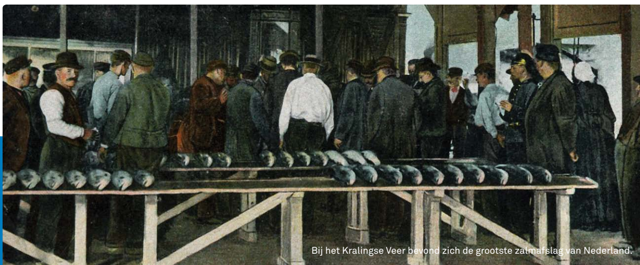
Bij het Kralingse Veer bevond zich de grootste zalmafslag van Nederland.

In 1885 werd een verdrag gesloten tussen Zwitserland,