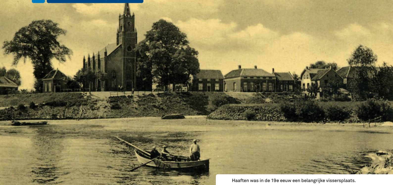
Haften was in de 19e eeuw een belangrijke vissersplaats.