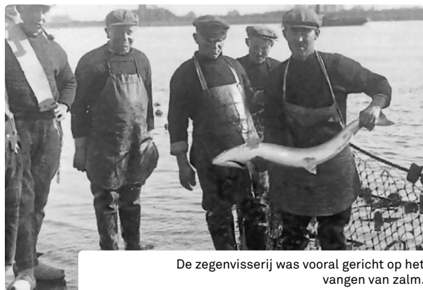
De zegenvisserij was vooral gericht op het vangen van zalm.