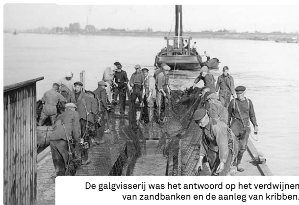
De galgvisserij was het antwoord op het verdwijnen van zandbanken en de aanleg van kribben.