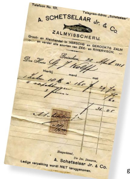
Uit deze nota uit 1911 blijkt dat de zalm zeker geen goedkope vis was.

In gelijke tred met het aantal zalmen, nam het aantal beroepsvissers op de grote rivieren na de Eerste Wereldoorlog snel af. In 1918 waren er nog acht grote zalmzegenvisserijen op de Nederlandse rivieren, in 1921 nog vier en in 1931 viel het doek voor de laatste. De kleinschaliger zegenvisserijen op de Waal en Maas bleven langer op de been, al werden de actieve visserijperioden gaandeweg korter en het aantal vissers kleiner. Ook aan de Beneden-Waal moesten de vissers op zoek naar ander werk, hetgeen ze veelal in de landbouw of op de baksteenfabrieken langs de rivieren vonden. Een ander deel schakelde over op een andere visserij. Zo bood de opkomende ankerkuilvisserij op paling steeds meer emplooi, vooral voor de vissers uit Rossum en Heerewaarden. Tientallen schokkers waren op de Maas en Waal te vinden, tot ver stroomopwaarts in Duitsland. Ook de drijfnetvisserij bleef – zij het in beperkte vorm – nog decennia bestaan. Hier was het de fint die in de visserij de plaats innam van de zalm en elft en zeker tot aan de Tweede Wereldoorlog een bijdrage leverde aan het voortbestaan van de riviervisserij in Gelderland. V