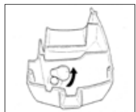
Husqvarna 346 XP