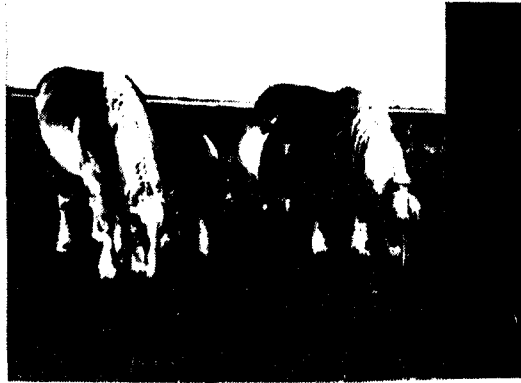
Nederlandse trekpaarden met veulens in Zuid-Limburg

len nog menen, dat zij hun plicht hebben gedaan als zij ijverig op hun bedrijf werken en bij gelegenheid eens een praatje houden met hun buurman en collega. Wil de boer zich in de toekomst handhaven, dan moet hij naar buiten, temidden van zijn mede-Nederlanders en straks van zijn mede-Europeanen. Misschien zullen sommigen vragen of dit opgaan van de boeren in het grotere geheel van ons volk er niet toe zal leiden, dat veel van hetgeen men als karakteristiek voor boer en platteland beschouwde, verloren zal gaan. Ik kan dat niet ontkennen en als geboren en getogen plattelandstreuer ik dat zelfs. Maar het is onvermijdelijk. Voor een boerenstand, die als een min of meer afzonderlijke groep een eigen leventje leidt, is in de toekomstige maatschappij geen plaats. Dit betekent niet, dat de boer zijn persoonlijkheid moet opgeven en een slaafs navolger van anderen moet worden. Artsen, onderwijzers, leraren, ambtenaren, zij hebben allen hun eigen kenmerken, hun typische gedragvormen, hun eigen normen ten opzichte van hun beroep en van hun positie. Maar zij leven en werken te midden van anderen en weten juist daardoor waardering voor hun positie en hun werk te wekken. Iets overdreven kan men stellen, dat de boeren zich nu nog vaak als groep tegenover alle anderen zien, in de toekomst zullen zij, elk voor zich, bewust moeten willen staan te midden van vertegenwoordigers van vele andere groepen.