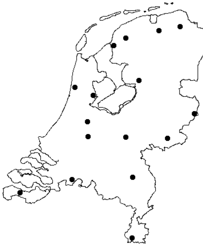
Kaart 2.1 Overzicht van de situering van de zestien bedrijven met oude graslanden waar genetisch materiaal is verzameld

Oude of traditionele graslanden liggen niet voor het oprapen en een overzicht van bedrijven met oude graslanden ontbrak. Het CGN heeft bedrijven opgespoord door gebruik te maken van haar netwerk met veredelingsbedrijven die leiden tot contacten met personen die zelf oud grasland hadden dan wel zo'n perceel in de buurt wisten. Op die manier is in 1997 en 1998 een groep van vijftig landelijk verspreid liggende bedrijven 1 met minimaal één perceel oud grasland gevonden waar toen een bemonstering van zaad van witte klaver heeft plaatsgevonden.