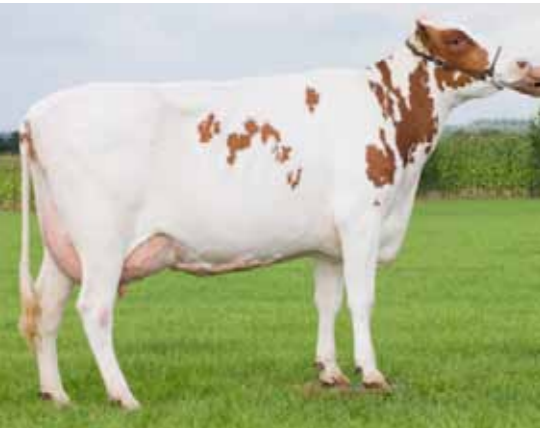
Heerenbrink Coba 109 (v. Savard), kampioene midden roodbont Prod.: 2.00 423 10.101 4,35 3,61 lw 104