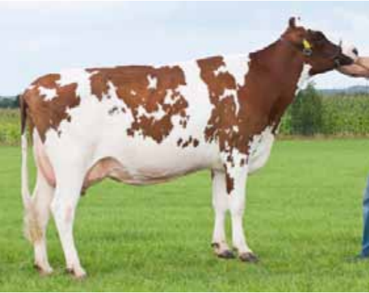
Feikje (v. Curtis), kampioene vaarzen roodbont Prod.: 2.02 283 8.576 4,17 3,63 lw 118 l.l.