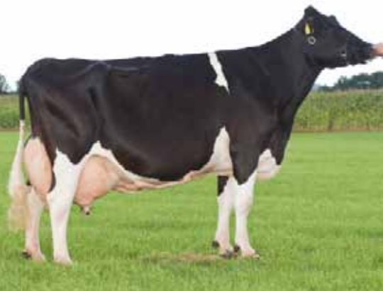
Ad Bertha 104 (v. Starbuck Flip), kampioene senioren zwartbont Levensprod.: 2474 66.787 4,77 3,63