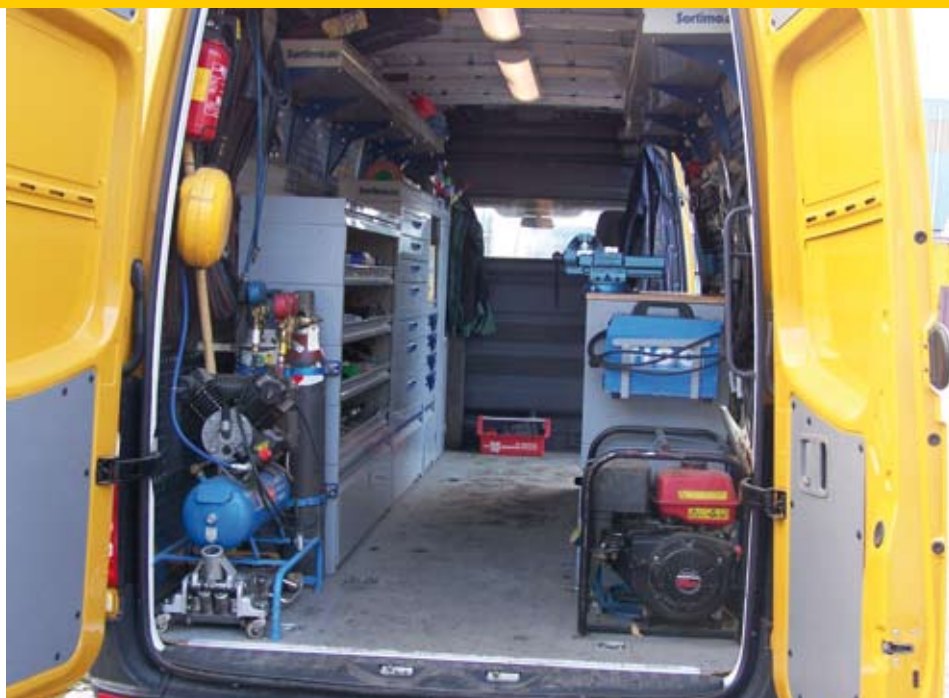
De monteurs gaan bij de machines langs, ook bij klanten in België en Duitsland.