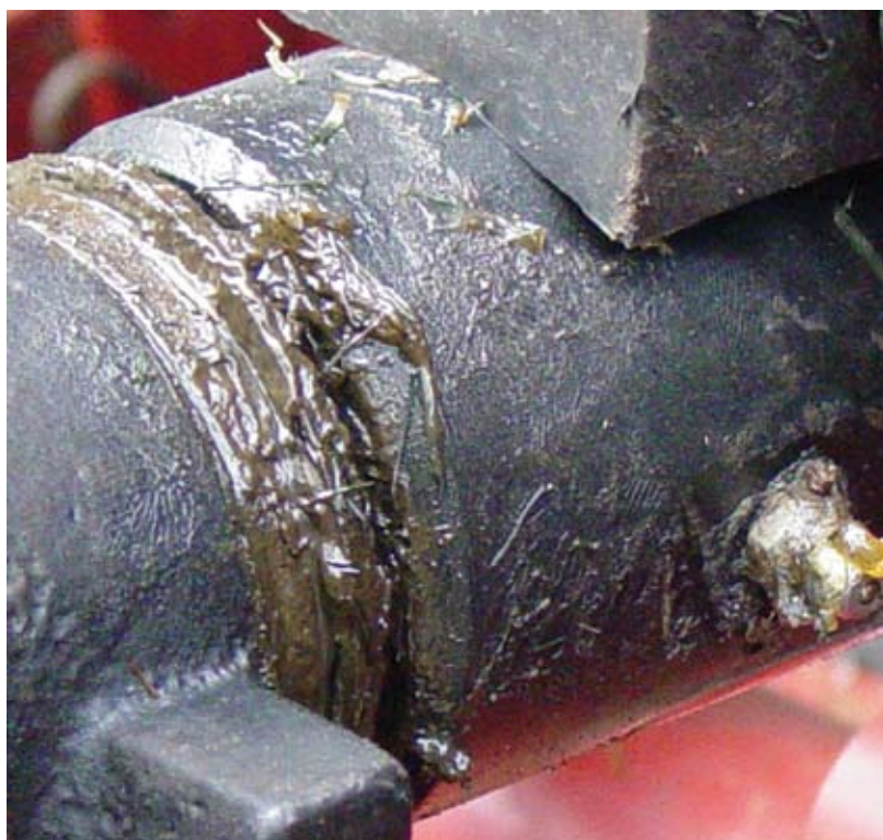
Vergeet na het afspreken nooit je machines op de juiste wijze door te smeren.