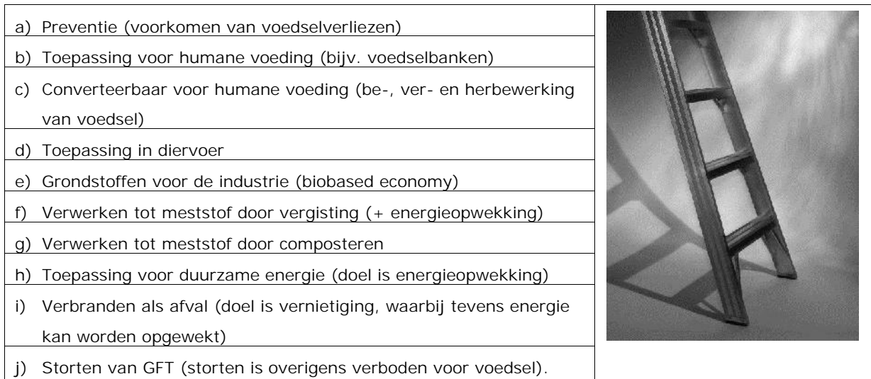
Figuur 2: Ladder van Moerman