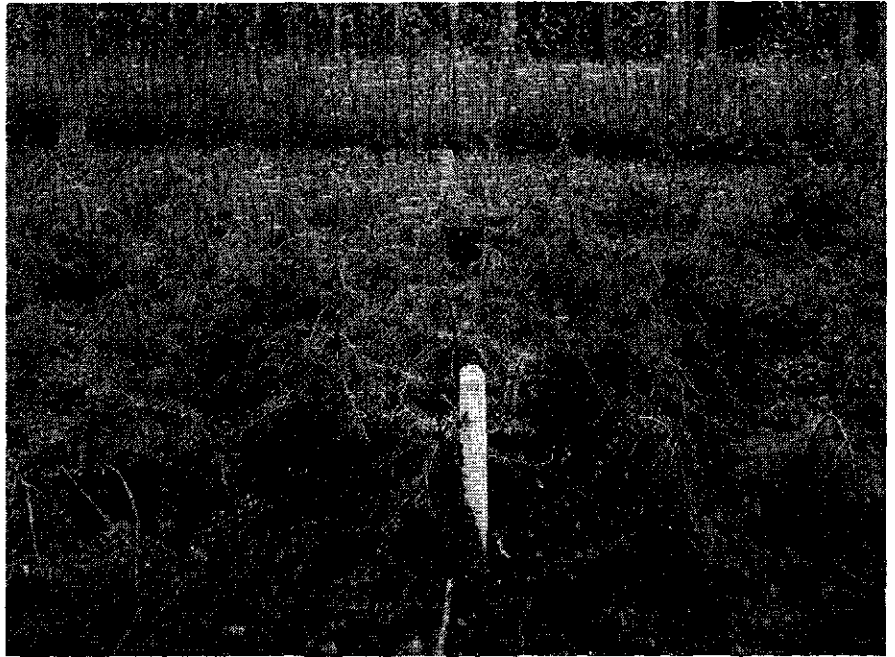
Foto 3: Douglasplanten te Gees, vóór de toediening van kopersulfaat (april 1964) (Douglas fir transplants, before application of copper sulphate (April 1964))

oorspronkelijk in dit terrein aanwezige opstand van groveden moest worden gerooid wegens vogelschade (reigerkolonie).