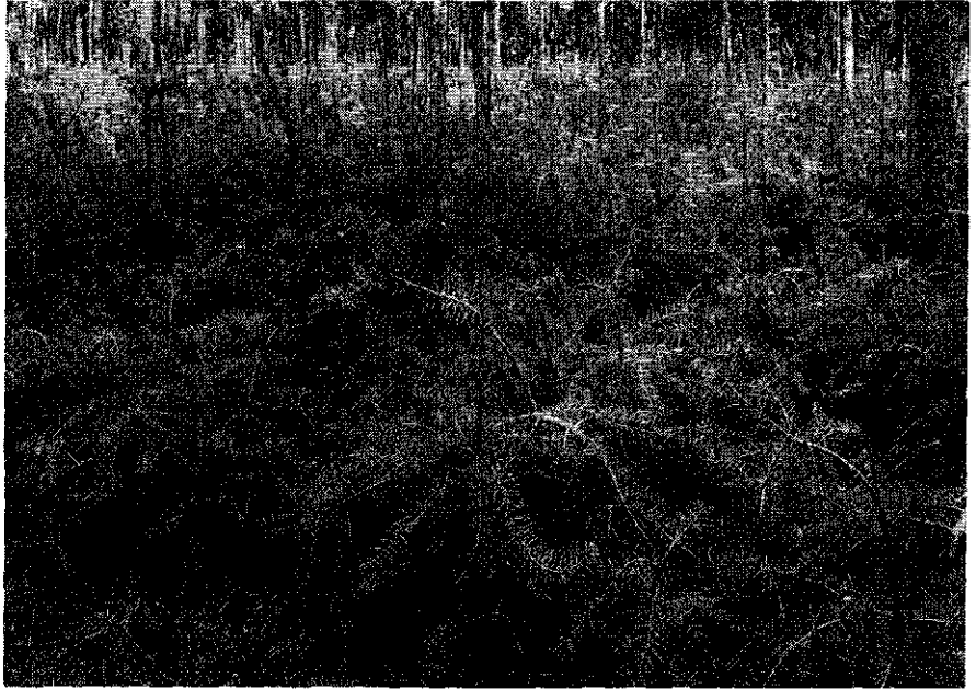
Foto 4. Douglasplanten te Gees, gefotografeerd in september 1964 na toediening van kopersulfaat (achtergrond) en borax (voorgond) in mei 1964 (Douglas fir transplants at Gees, photographed in September, 1964, after application of copper sulphate (background) and borax (foreground) in May, 1964)

Behalve door bemesting met kopersulfaat kon ook door het opzuigen van een kopersulfaatoplossing, via een inkeping in de stam, in één groeiseizoen herstel van kromgroeïende planten worden verkregen. Dit herstel werd alleen door toediening van 5 mg kopersulfaat in 1 liter water bereikt.