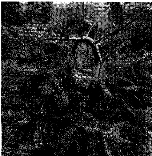
Foto 2: Misvormde achtjarige douglas te Oranjewoud ( deformed eight year old Douglas fir at Oranjewoud )