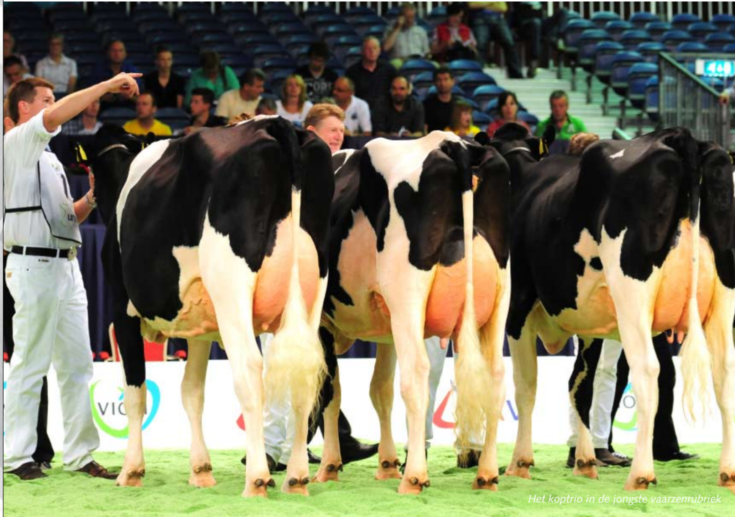
Het koptrio in de jongste vaarzenrubriek