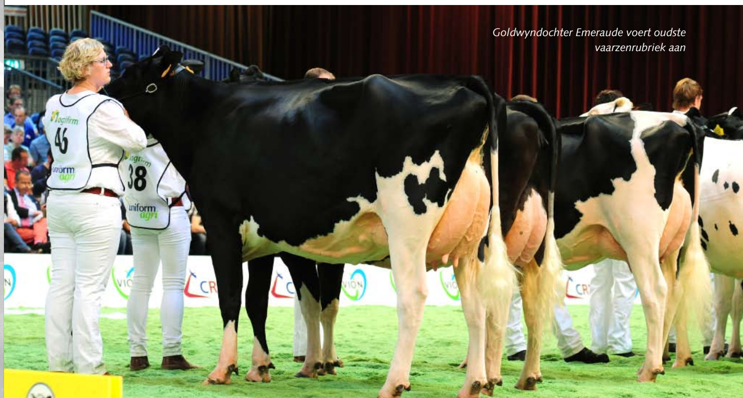
Goldwyndochter Emeraude voert oudste vaarzenrubriek aan