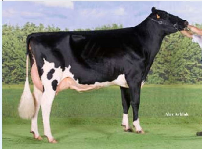
Emeraude (v. Goldwyn), 1a in rubriek 3 Productie: 2.03 305 10.593 4,03 3,32