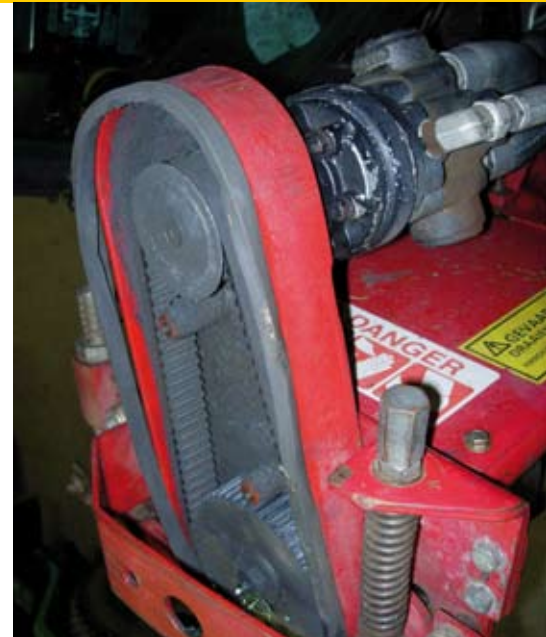
Aandrijving van het rondsel geopend voor een inspectiebeurt.

maakt natuurlijk verschil om zo weinig mogelijk tijd kwijt te zijn bij de dagelijkse inspecties. Daarentegen hangt het natuurlijk ook af van je baan. Ofschoon het systeem op grotere banen nog steeds voorkomt dat je tussenbeurten in het seizoen plant en in de winter groot onderhoud laat uitvoeren, zijn er ook situaties met kleinere banen waar het groot onderhoud op basis van de bedrijfsuren slechts eenmaal in de twee jaar nodig is. Anders dan in de industrie en bij onze auto's is de maaiparaatuur maar zelden uitgevoerd met