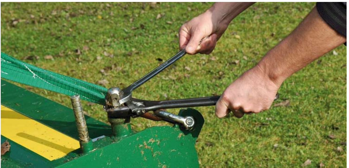
Goede afstellingen vormen de basis voor goed oordeelkundig gebruik.

werken niet met een onderhoudscontract, maar voeren het onderhoud volledig zelf uit. Een van de medewerkers met een technische opleiding is hiervoor verantwoordelijk. Hij heeft hier voor veel vrijheid. Wanneer er tijd over is, verricht hij ook andere werkzaamheden. Alleen het slijpen van de messen besteden we uit. Maar als onderhoud nog onderdeel van de garantie uitmaakt, laten we dit verrichten door de leverancier of de dealer. Volgend seizoen vindt bij Agrec Golf de start plaats van een nieuwe