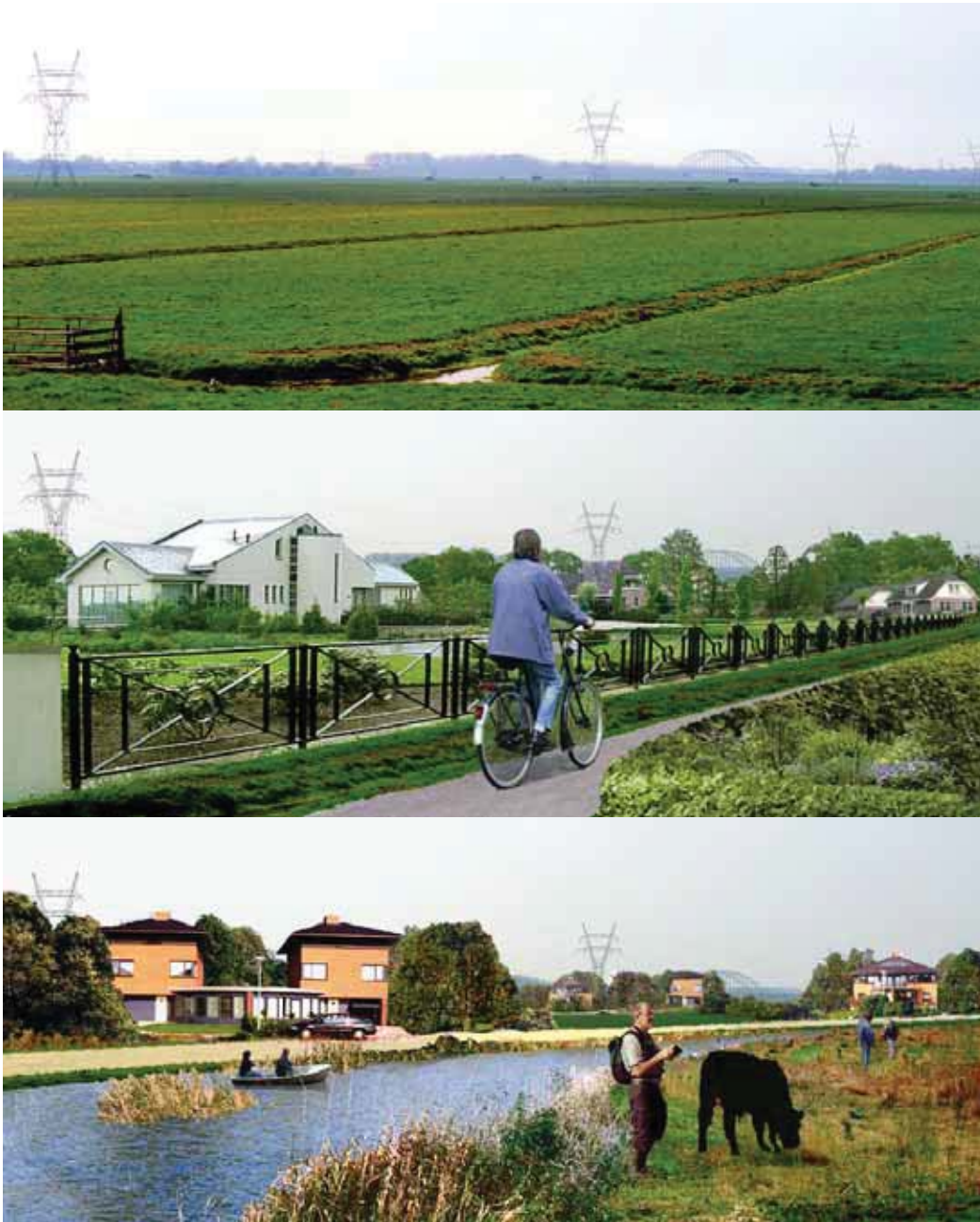
Figuur 6.3. De concept-structuurvisie van de provincie voorziet in ruim 1100 woningen, 210 ha recreatief groen, 60 ha infrastructuur en waterberging in het Muidense deel van de Bloemendalerpolder (335 ha). Pas 70 ha is in bezit van de overheid. De uitwerking van de structuurvisie samen met projectontwikkelaars is noodzakelijk, aangezien die al de helft van de grond gekocht hebben. De opbrengst uit ruime woningen in het groen zal de recreatieve kwaliteit van dit uitloopgebied van Amsterdam-IJburg, Diemen en Amsterdam-Zuidoost bepalen. De simulaties geven een indruk van een minimale (midden) en een goede recreatieve kwaliteit (onder).

Simulaties: Janneke Roos-Klein Lankhorst op basis van fotomateriaal Wim Nieuwenhuizen Sylvia Blok en Marjolein Bloemmen.