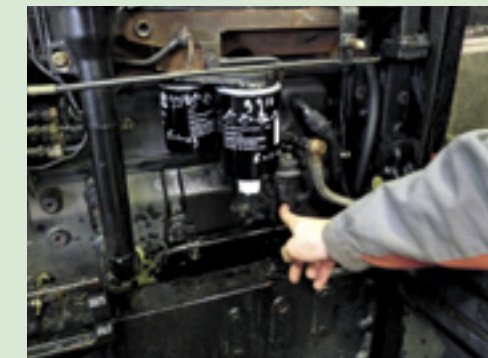
▲ Vul de brandstoffilters alleen met behulp van de opvoerpomp en vul ze niet vooraf. Hiermee voorkom je vervuiling van de filters. Met name bij commonrailmotoren is dit cruciaal. Schade aan het brandstofsysteem belooft gauw duizenden euro's. Noteer ook de datum en urenstand op het filter.