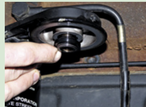
▲ Vervang bij het brandstoffilter ook altijd de bovenste O-ring. Deze kan beschadigd raken, waardoor de brandstof langs het filter gepompt kan worden zonder filtering, of, erger nog, rubberdeeltjes in het brandstofsysteem komen.