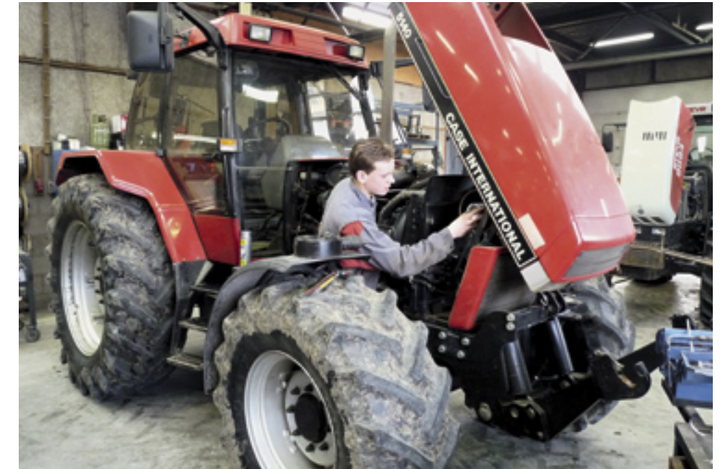
▲ Bij groot onderhoud tijdens een winterbeurt wordt de gehele trekker nagekeken. Je kunt overigens best een ander zelf doen, maar houd je aan de voorschriften van de fabrikant.