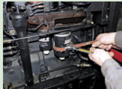
▲ Om een filter te demonteren dien je na te gaan hoe deze is gemonteerd. Over het algemeen zijn het schroeffilters, en deze kun je goed met een filtertang losdraaien. De tang op de afbeelding werkt doeltreffend en voorkomt kapotdraaien van het filterelement.