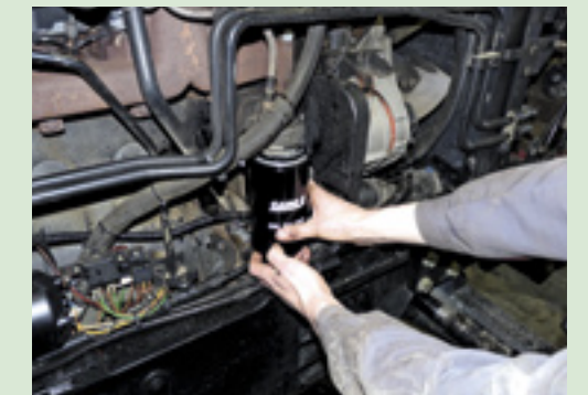
▲ Na het aftappen van de motorolie dien je ook het oliefilter te vervangen. Ook hier geldt dat je schoon moet werken en de afdichting dient in te vetten. Draai de filters altijd vast met de hand en niet met een tang, anders zijn ze nadien niet meer los te draaien.