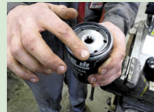
▲ Het schroeffilter is voorzien van een rubberafdichting. Vet deze voor montage in, zodat het filter soepeler los zal draaien bij een volgende beurt. Let wel op dat je het juiste filter op de juiste plaats bevestigt. Er kan verschil zijn tussen het voor- en hoofdfilter in verband met waterafscheiding.