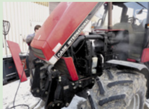
▲ Bij onderhoud aan de trekker is het belangrijk deze eerst goed te reinigen met een stoomcleaner voorzien van een licht ontvettend reinigingsmiddel. Bij het vervangen van filters dien je altijd te voorkomen dat er stof en vuil van de omgeving in het nieuwe filter of leidingwerk komt.