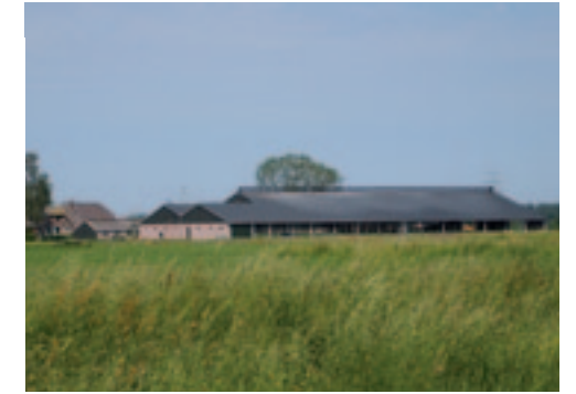
Zicht op het bedrijf in Oene.