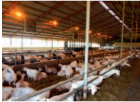
De stal is open en fris.