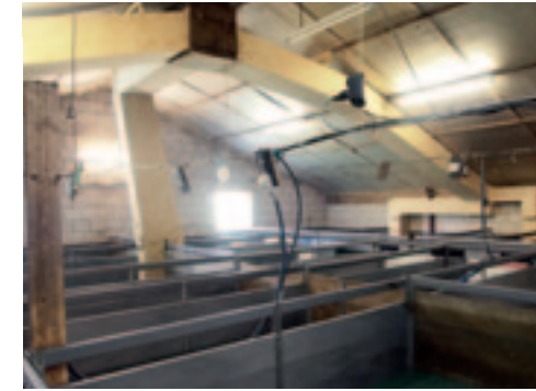
De lammerenopvang gebeurt in de oude varkensstal. De ventilatie is aangepast.