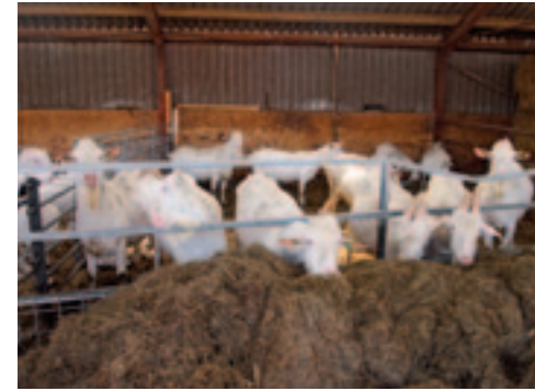
Schuurman heeft zelf een paar bokken gehouden en een aantal gekocht.