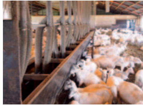
De melkgeiten kunnen, naast kuilgras, onbeperkt brok eten.