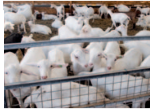
De vijf maanden oude lammeren van Schuurman zijn al grote dieren.