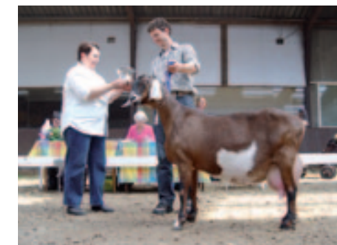
De Claycroftbeker gaat naar Lady Diana van Oudwoude van combinatie De Boer.