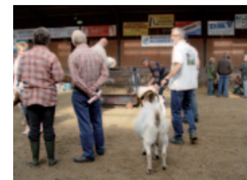
Iedere Boergeit moest over de weegbrug, er was zelfs sprake van een file.