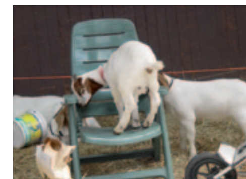
Ondeugden tijdens de keuring.