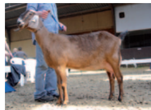
De uierprijs ging naar Lacosta van Oudwoude.