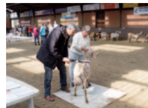
Meten met twee maten. Vanaf nu is kruishoogte bepalend.