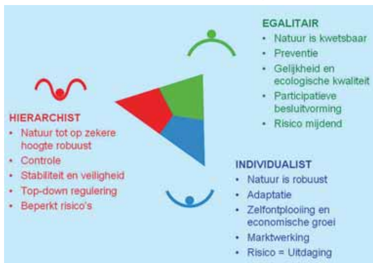
Afb. 1: Enkele generieke kenmerken van de perspectieven in de typologie.