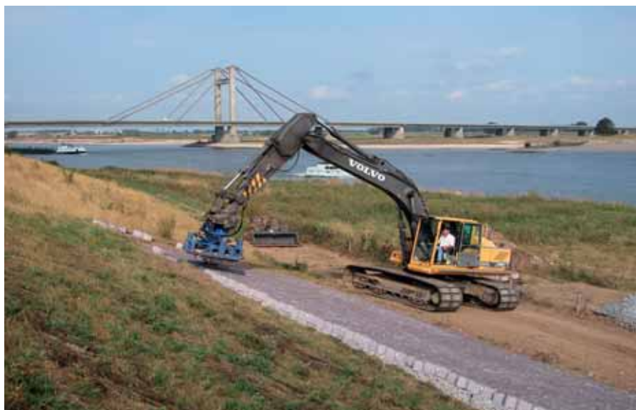
Dijkversterking bij Beneden-Leeuwen.

Vanuit dit standpunt beschouwd biedt het denkkader van de perspectievenbenadering een aantal aangrijpingspunten om te komen tot een robuuste waterstrategie. Ten eerste kan worden nagegaan of de verschillende perspectieven wel voldoende in de huidige discussie over klimaatverandering en waterbeheer vertegenwoordigd zijn. Uit afbeelding 2 blijkt dat de huidige set aan mogelijke oplossingen het palet aan perspectieven redelijk dekt. De nadruk ligt op de hiërarchistische en individualistische invalshoek en duidelijk minder op de egalitaire. Een egalitaire insteek als 'water stuurt' is aanwezig, maar haar extreme variant 'het verlaten van lagergelegen gebieden' wordt in geen enkele beleidscontext serieus overwogen. Het is dus de vraag of de 'echte' egalitaireren wel voldoende worden gehoord.