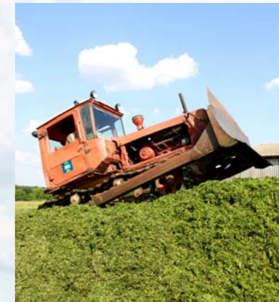
Gras wordt ingekuuld met een rupstrekker