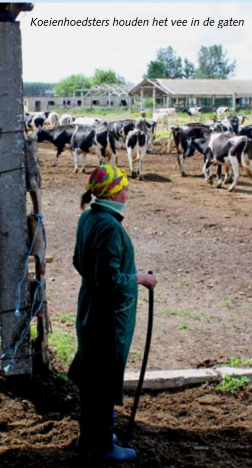
Koeienhoedsters houden het vee in de gaten

de melkveehouderij. Terwijl de professionele bedrijven failliet gingen, bloeide het koeienbezit op het arme platteland op. Met een gemiddeld inkomen van 100 euro per maand zijn dorpsbewoners afhankelijk van hun eigen moestuin en houden ze een varken en koe om wat bij te verdienen. Tussen de zestig en tachtig procent van de melkproductie komt volgens schattingen voor rekening van deze huis-tuin-en-keukenboeren die gemiddeld anderhalve koe hebben.