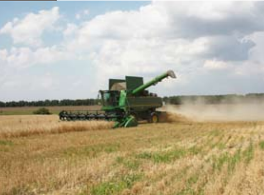
Goede opbrengsten van vruchtbare aarde