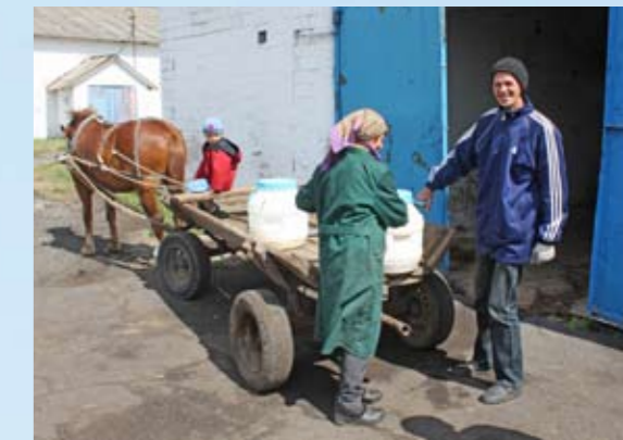
Melk voor de kalveren per paardenwagen

Daarnaast kunnen agrarische ondernemingen geen land kopen. Op het moment dat de kolchozen en de landbouwgrond onder de dorpsbewoners werd verdeeld, riep de overheid een wet in het leven die de verkoop van landbouwgrond verbiedt. Onduidelijkheid over deze wet houdt de gemoederen bezig. De politiek discussieert al jaren over de afschaffing ervan. In afwachting hiervan zijn velen niet bereid langdurige contracten aan te gaan, waardoor agrarische ondernemingen feitelijk op los zand gebouwd zijn. |