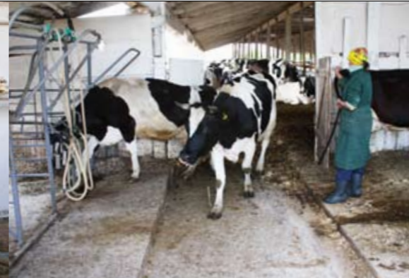
De melkstal is eenvoudig