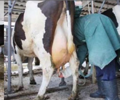
Melken kost het nodige bukwerk