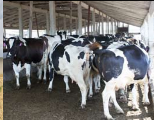
Een overkapping dient als stal