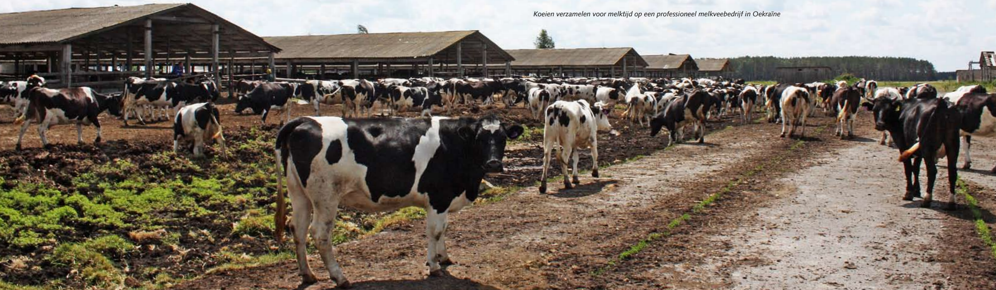
Koeien verzamelen voor melktijd op een professioneel melkveebedrijf in Oekraïne

Na de val van de Sovjet-Unie voltrok zich een andere opmerkelijke ontwikkeling in