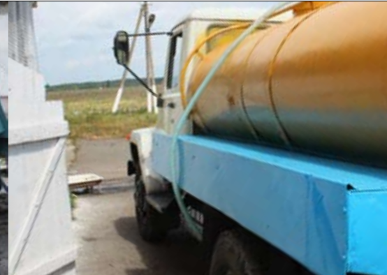
De tankwagen wacht geduldig