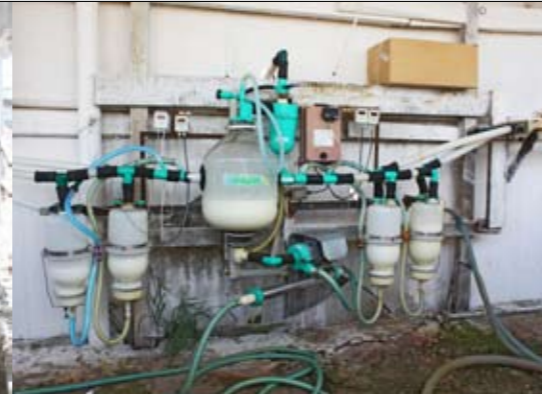
Een melkinstallatie voor 200 koeien