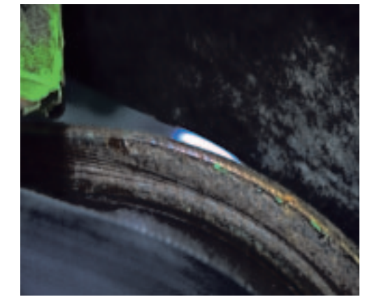
▲ Groeven in het plaatwerk rondom de rollen maken duidelijk dat de afvoerband scheef heeft gelopen.