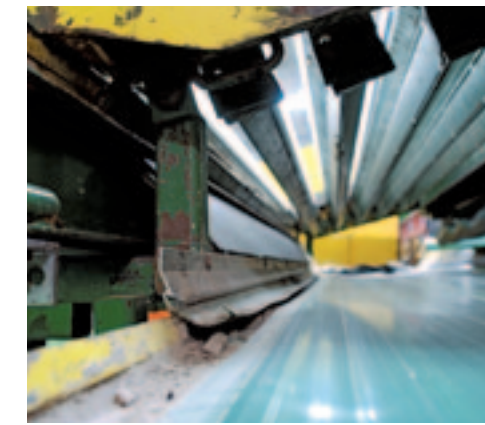
▲ Om te zien of een afvoerband aan slijtage onderhevig is, hoef je geen expert te zijn. Kijk altijd onder de rubberflappen.