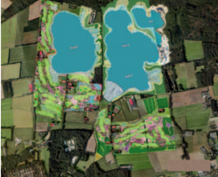
Masterplan van de golfbaan Stippelberg.