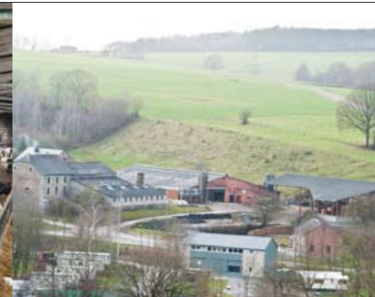
Het bedrijf ligt in het hart van de Ardennen

Jacques Quiryren melkt zijn koeien jaarrond in een moderne melkwagen