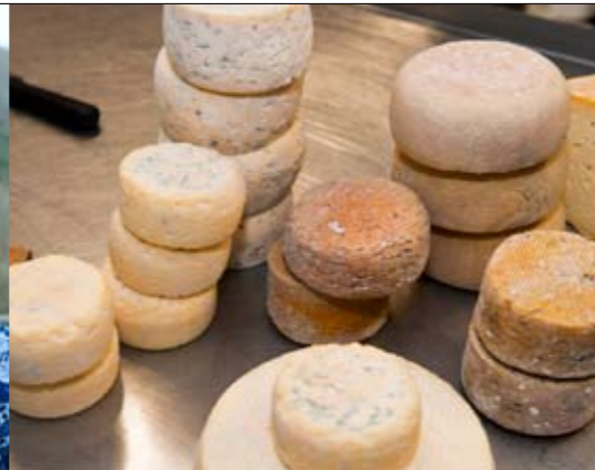
Een deel van de melk verwerkt Martine tot kaas