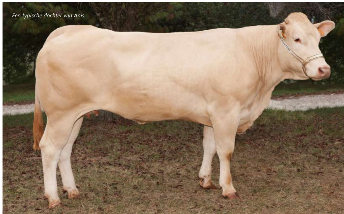
Een typische dochter van Anis