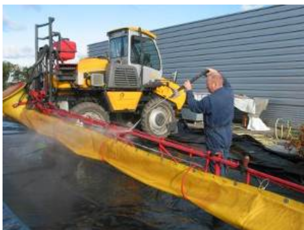
Foto 1: Door het schoonmaken van spuitapparatuur met water kan bij lozing op het riool of oppervlaktewater de waterkwaliteit in gevaar komen.

Puntemissies zijn hoofdzakelijk verontreinigingen die ontstaan bij het vullen en het reinigen van de spuitapparatuur op het erf en bij het beheer van de overgebleven spuitvloeistof (Foto 1). Het gaat hier om morsen bij het vullen van spuit, overlopen van de spuitmachine tijdens vullen, lekken van leidingen of doppen en lozen van spuitresten of waswater (Basford et al. , 2004; Debaer & Jaeken, 2006; De Wilde et al. , 2007; Jaeken & Debaer, 2005; Wenneker, 2007). In het buitenland wordt de bijdrage door deze puntbelastingen aan vervuiling van het oppervlaktewater op 40-90% geschat (Bach et al. , 2005; Carter, 2000; Kreuger & Nilsson, 2001; Mason et al. , 1999; Müller et al. , 2002). Naast puntemissies rond het spuiten zijn er ook risico's bij het be- en verwerken van plant- en zaaigoed en geoogst product. Denk bijvoorbeeld aan het schoonmaken of afregenen van zaa- en pootmachines die met middelen in aanraking gekomen zijn, lekkage bij het dompelen van plantgoed en water uit sorteerinstallaties van appels en peren.