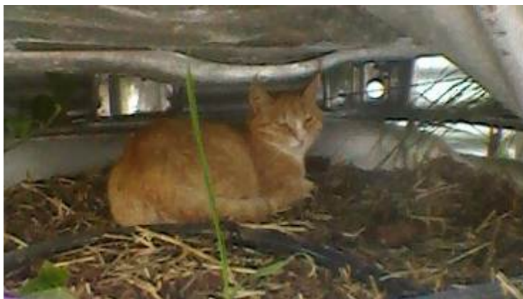
Foto 4: de meest aannemelijke verklaring voor het onverwacht aantreffen van permethrin (o.a. vlooienmiddel) in het effluent

Een bijzonder voorbeeld van een stof die wel in het effluent aangetroffen werd, maar niet in het influent zat, was permethrin. Deze stof is op twee locaties in lage concentraties gevonden in het effluent. Permethrin kent geen gewastoeepassingen, maar mag gebruikt worden in onder andere insectensprays, mierenlokdozen, maar ook als vlooienmiddel voor honden en katten. Illegaal landbouwkundig gebruik is niet aannemelijk. De meest aannemelijke verklaring voor het aantreffen van permethrin in het effluent is een kat die een mooi plekje tussen de plastic bakken van het biofilter heeft gevonden (Foto 4). Dit aangetroffen voorbeeld is demonstratief voor mogelijke verklaringen van onverwachte meetresultaten. Hier kom je soms alleen per toeval achter. De kat is overigens niet geanalyseerd.