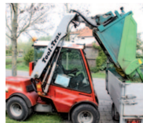
■ De Tool-Trac tilt tot maximaal 2,5 meter hoogte. Lossen in een aanhanger is geen probleem.