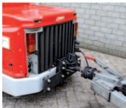
■ Een automatisch vergrendelende haak is geen overbodige luxe.

Behalve het reguliere smerewerk heb je naar de Poop Scoop weinig omkijken. Het smeren is in een handomdraai gebeurd. De Multi-Trac heeft enkele moeilijk bereikbare nippels. Hiermee ben je iets langer bezig. Ook is het zaak om het pendelende gedeelte van de Poop Scoop goed gesmeerd te houden. Het nastellen van V-snaren blijkt in de praktijk nooit voor te komen. Wel kan er tijdens het maaien een keer een groot stuk hout tussen de messen slaan. Daardoor kunnen de messen de timing kwijtraken en tegen elkaar slaan. Omdat de kunststof bezem alleen in het gras draait, is de slijtage van dit onderdeel gering. Vervangen is daarom maar sporadisch nodig. Omdat de aanhangwagen achter de Tool-Trac vaak aan- en afgekoppeld moet worden, is een automatische vanghaak een must. Je hoeft dan alleen nog maar de steunpoot op te tillen en de verlichtingsstekker erin te steken. ■