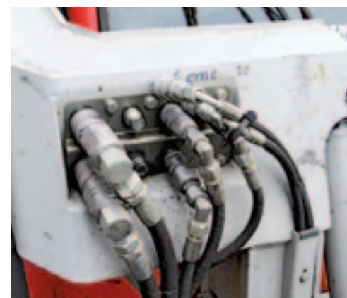
■ De Poop Scoop is volledig hydraulisch aangedreven. Eén grote snelkoppeling ontbreekt nog.