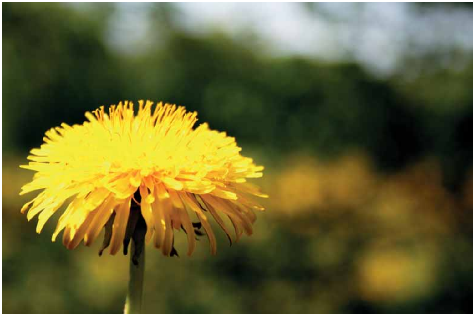
'Het licht op de paardenbloem. Het prachtige geel van de bloembladeren. Het telt niet meer mee.'

ten die wetenschap met zich mee kan brengen. Wetenschap is reductie. Abstractie tot slechts een klein flintertje van de werkelijkheid is overgebleven. Weliswaar een nut-