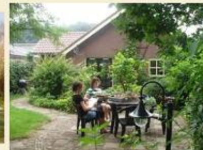
Tuin bij De Boerenstee