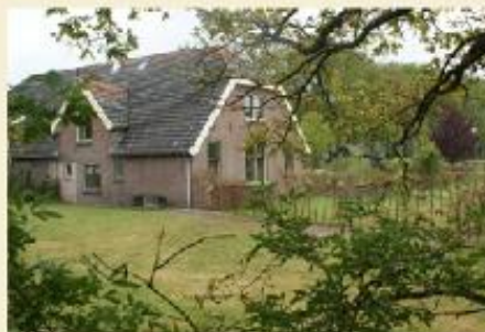
Hofstede Hooybroeck vanaf de Linledijk

Logeren - vergaderen - groepsaccommodatie - verzorgde arrangementen - bed & breakfast