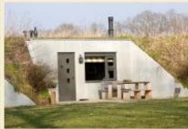
Een linehut vroeg in het voorjaar