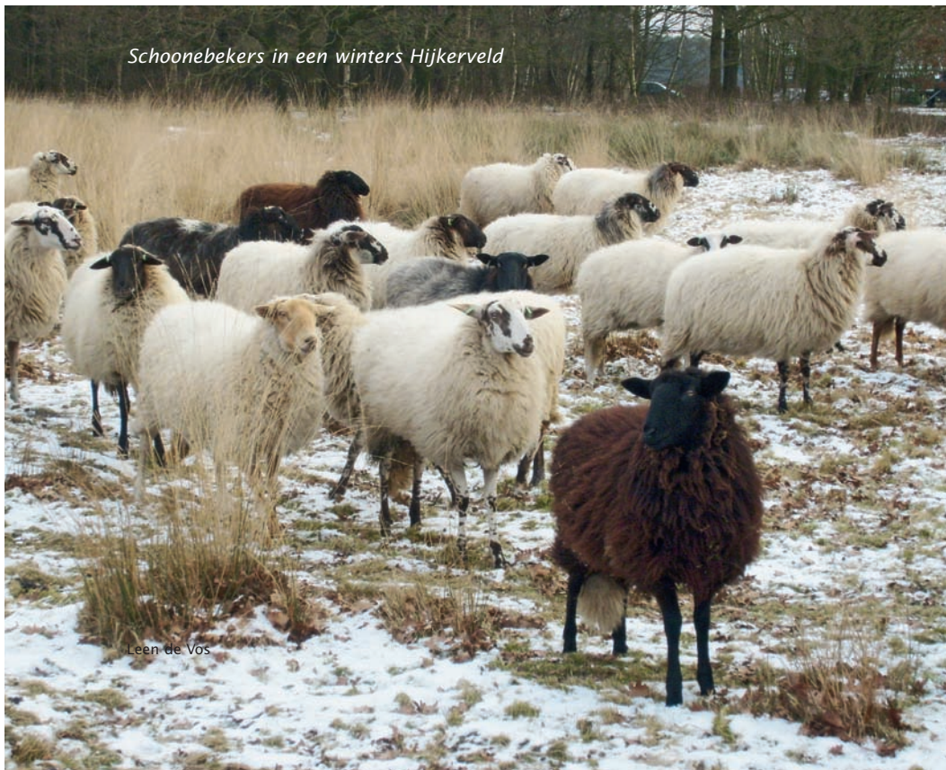
Schoonebekers in een winters Hijkerveld

Bij het Hijkerveld zijn een schaapskooi en een informatiecentrum gevestigd waar de bezoekers de nodige informatie over het Hijkerveld en Het Drentse Landschap kunnen vinden. De schaapskooi is een voormalige, aangepaste landbouwschuur. Daarin overnachten de Schoonebekers. Door de dieren 's nachts in de kooi te houden wordt de nodige mest geproduceerd. Die mest is weer geschikt voor de graanvelden. 's Winters worden de dieren bijgevoerd met eigengewonnen ruwvoer. Een ander voordeel van het overnachten in de potstal is dat de schapen 's morgens, als de scheper met de kudde de hei optrekt, meer honger hebben. Dat komt het begrazingsgedrag ten goede. Alleen bij erg warm