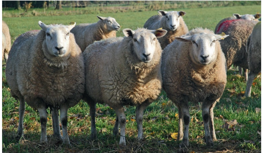
Onze Texelaar is van oorsprong een Engels ras

We moeten er wel bij zeggen dat volgens het DNA de Texelaar een Engels ras is. Dat is geen wonder gezien de Engelse rammen die in de negentiende eeuw veelvuldig op bezoek kwamen. Het is ook zeker niet het enige continentale ras met Engelse voorouders. Verder lopen er overal ter wereld