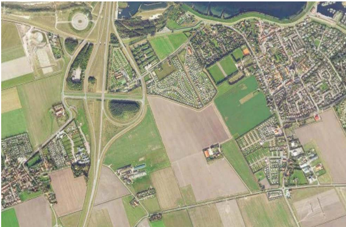
Locatie de Balans

Het leren is de basis van 'de Balans'. Met leren bedoelen wij dat we als mens zowel individueel als collectief gedurende ons leven op verschillende manieren kennis en ervaring kunnen opdoen. Met deze kennis en ervaring kunnen we wijsheid ontwikkelen. Daarnaast wordt er gezocht naar mogelijkheden van innovatieve ontwikkelingen betreffende de financiële kosten/baten-verhoudingen bij het ontwikkelen en instandhouden van 'de Balans' als geheel. Per kernactiviteit is er een plan van aanpak, hierin worden doelen voor de korte en lange termijn beschreven, regelmatig getoetst en gezocht naar gezamenlijke verbeterpunten.