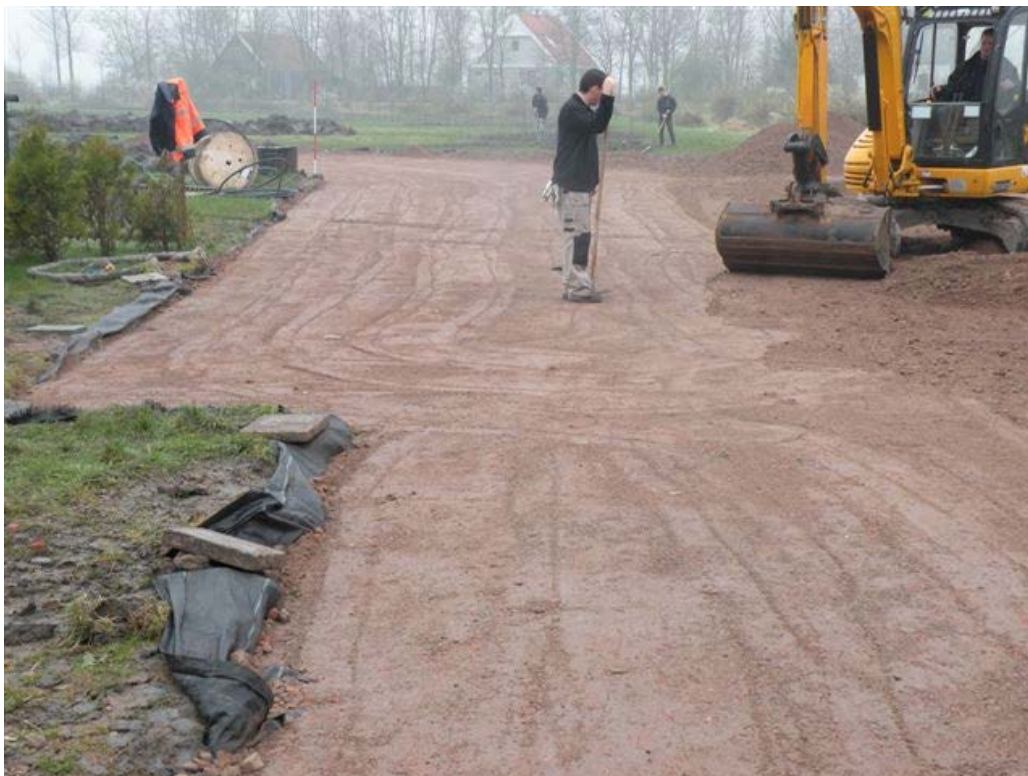
Aanleg toegangsweg minicamping