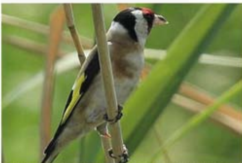
De pulter, een vogelsoort die op de zwarte markt goed geld oplevert.