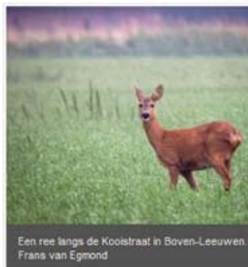
Een ree langs de Kooistraat in Boven-Leeuwen. Frans van Egmond

© Gelderlander 2012, op dit artikel rust copyright.