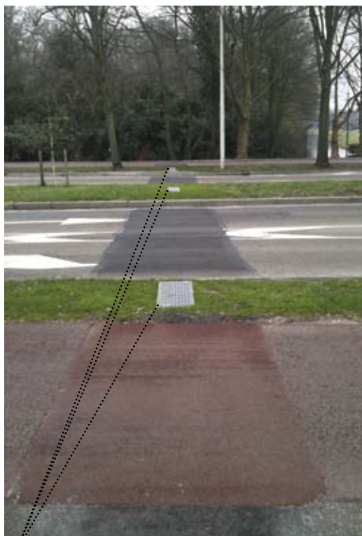
De roosters zorgen voor lichtinval.