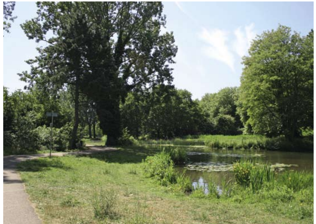
Haagse beek bij Rode Kruisplantsoen.