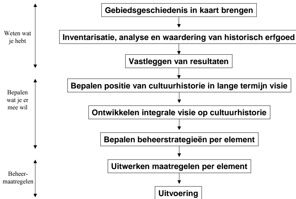
Figuur 2.2 Schematische weergave van het werken aan cultuurhistorie in het terreinbeheer