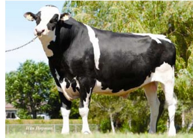
Canadese Fever omgerekend nummer één voor nvi

De Amerikaanse stier Planet (v. Taboo) voert de nieuwe Canadese LPI-top aan. Met 3217 punten staat Planet ver boven de nummer twee, De-Su Gillespy (v. Bolton), die 2689 punten krijgt. Van beide stieren zijn voor het eerst cijfers beschikbaar in Canada. De nieuwe omgerekende nummer één is Crackholm Fever, die 90 punten nvi steeg en er 51 euro inet bij kreeg. Fever stamt uit de koefamilie van Startmore Rudolph. Nieuwkomers B-Crest Shadow en Gen-I Beq Topside zijn de nieuwe nummers vier en vijf in de nvi-lijst. Shadow combineert een nvi van 201 met een torenhoog exterieur