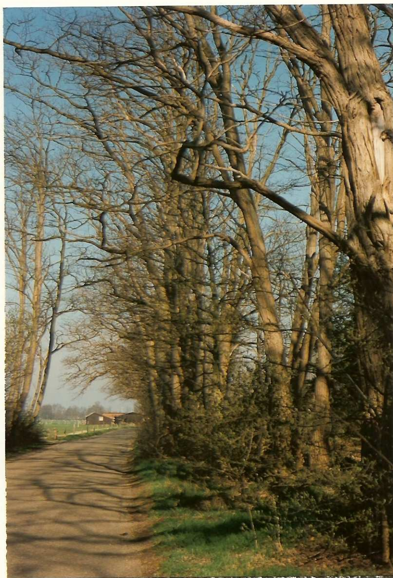
Acacia's langs Zuthemerweg