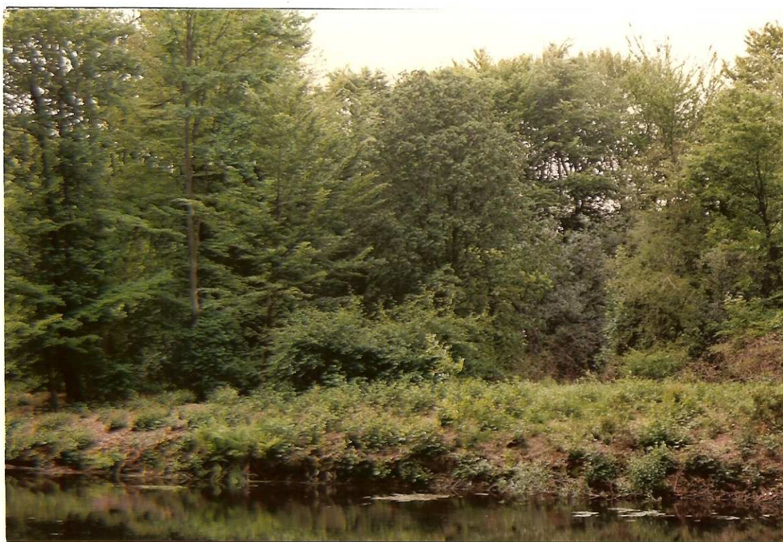
Zuidvrand van het grote Schiereiland