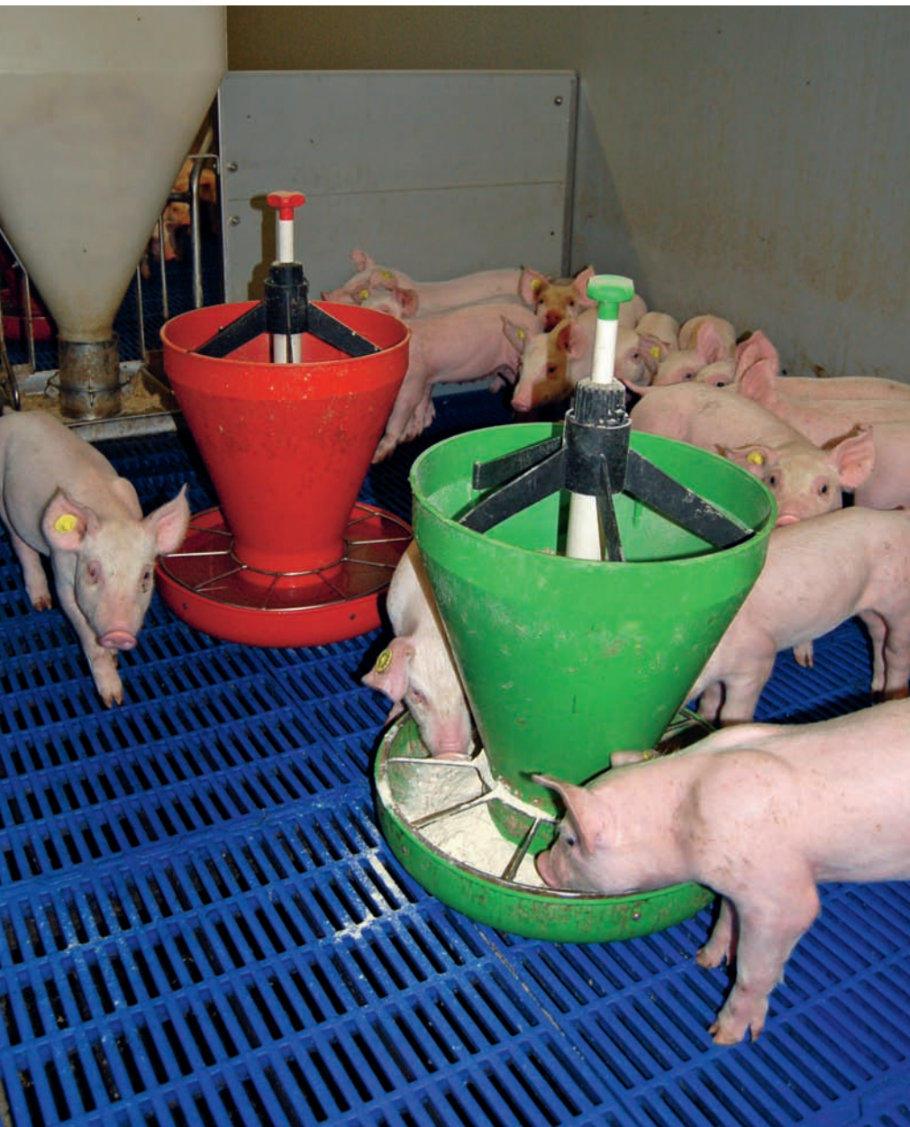
De biggen worden al in het kraamhok bijgevoerd met droge melkpoeder. Na het spenen kunnen de biggen dit voer gemakkelijk opnemen uit ronde voerbakken midden in het hok.

Varkenshouder Willy Wolfkamp paste tot drie jaar geleden standaard een antibioticumbehandeling tegen streptokokken toe bij de gespeende biggen. Toen ging de knop om en besloot hij om met een andere bedrijfsvoering de streptokokken te lijf te gaan.