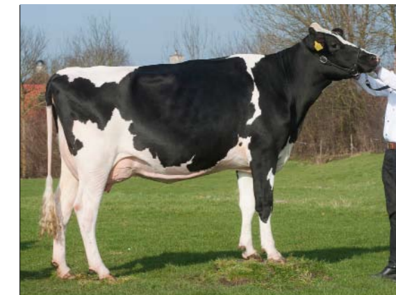
Dellia 3 (v. Danillo), juniorkampioene Prod.: 1.11 225 6618 4,33 3,52 lw 116 I.I.