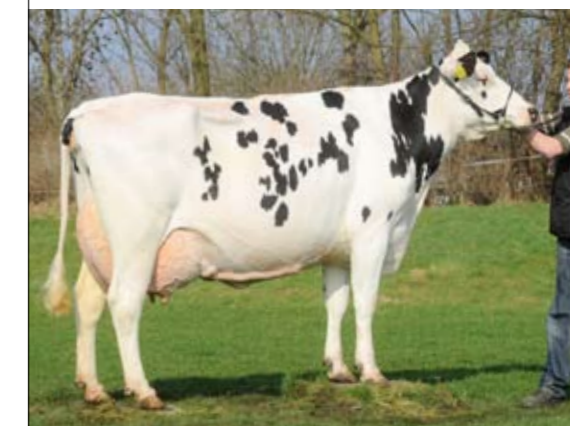
De Schothorst Jetske 361 (v. De Schothorst Modest), middenklaskampioene Prod.: 3.00 320 10.996 4,35 3,65 lw 117