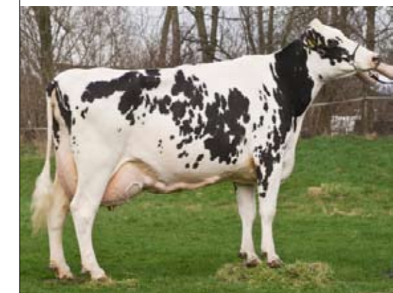
VVH Flower (v. Shottle), seniorkampioene Prod.: 1.11 637 17.623 5,01 3,90 lw 127