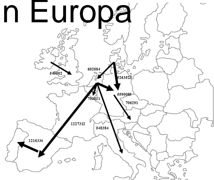
Figure 2: Main transports of pigs with country of origin and destination in 2006. Divided in transportation of more than 500,000 animals per year → and more than 1,000,000 animals per year →.