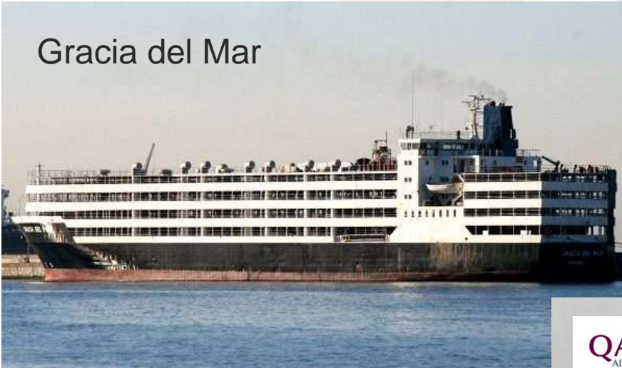
Gracia del Mar