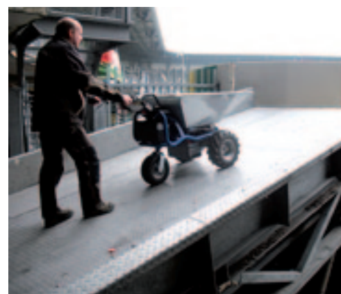
De Zallys kan hellingen tot 30 procent aan. Hier in het ADO-stadion is dat geen overbodige luxe.

De topsnelheid van de kruiwagen is 5 km/h en volgens opgave van de fabrikant kan de aandrijving hellingen tot 30 procent aan. Aan de voorzijde van de machine is een mechanisch gedwongen noodknop aangebracht. Dat is verplicht vanuit de arbo-wetgeving. Waarschijnlijk zul je hem nooit nodig hebben, want zodra je de rijkhendel loslaat staat de accukruiwagen direct stil.