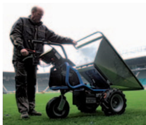
De kiepbak wordt ontgrendeld door het inknippen van een hendel. Kiepen gebeurt handmatig.

Het rijden met de Dumper-Jet kent weinig verrassingen, al moet je even leren doseren. Het rechterhandvat is de rijkhendel. Hoe harder je er aan draait, hoe harder de machine gaat rijden. Maar voordat de machine in beweging komt, moet eerst de rode hendel op het linkerhandvat worden ingedrukt. Een extra veiligheid. Net boven de rechterhendel zit een drukknop waarmee je wisselt tussen