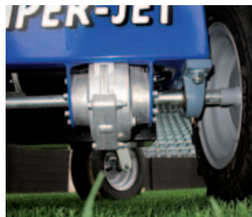
De aandrijving gebeurt via een differentieel in de vooras.

De accukruiwagen is leverbaar met een kiepbak en een laadvloer. De kiepbak is van staal en heeft een inhoud van 175 liter. De bak is vergrendeld via een pal aan de onderzijde. Ontgrendelen doe je door de handgreep onder de linkerhendel in te knijpen. Het kiepen gebeurt handmatig. Naast een kiepbak is er een laadvloer verkrijgbaar voor het vervoer van stenen of