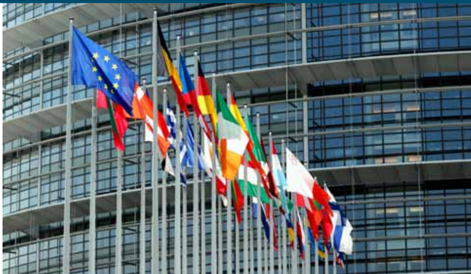
'Landen als Duitsland, Italië en Frankrijk houden verdere hervorming tegen.'

Een belangrijk onderdeel van de voorstellen die in oktober werden gepresenteerd, is dat boeren niet langer toeslagen gerelateerd aan productie krijgen maar gekoppeld aan aantal hectares. Landen die gewend waren aan een relatief hoge toeslag omgerekend naar hectares, krijgen vanaf 2014 wat minder; landen die gemiddeld minder ontvingen, krijgen straks iets meer. Per saldo zal er dan in totaal over de periode 2014-2020 6,4 miljard euro verschuiven van de oude naar de nieuwe lidstaten, ofwel 917 miljoen per jaar. Dat is een beperkte herverdeling van slechts een paar procent van het totale toeslagenbudget van het GLB, zo'n 43 miljard per jaar. Dat berekende GLB-coördinator Roel Jongeneel van het LEI, onderdeel van Wageningen UR. Los van de nieuwe hectaretoeslag stelt de Europese Commissie maatregelen voor om het beleid te vergroenen, de maximale steun per bedrijf af te toppen en