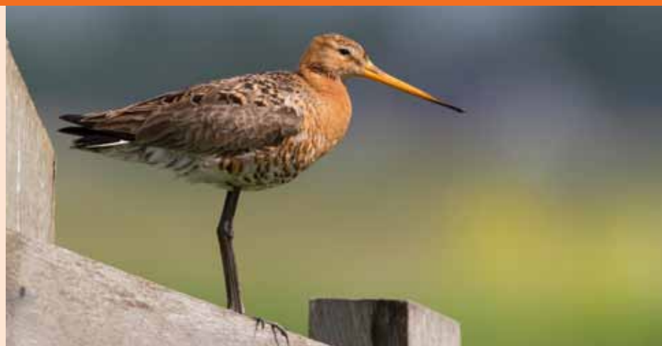
Het plan om zeven procent van het landbouwareaal te gaan gebruiken voor natuurdoelen gaat de grutto's en andere bedreigde weidevogels niet helpen.