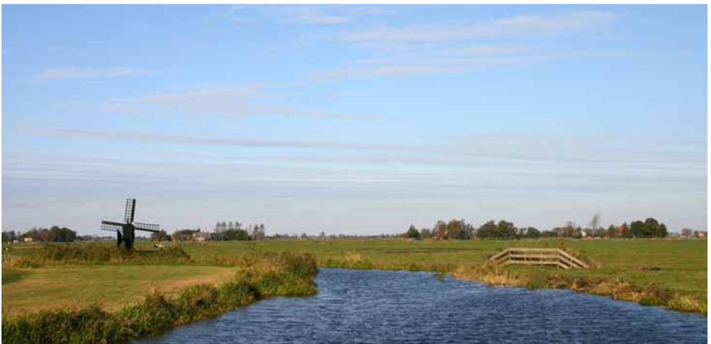
Waterland, één van de gebieden met een vereniging voor agrarisch natuurbeheer.

raymond.schrijver@wur.nl 0317 - 48 61 89