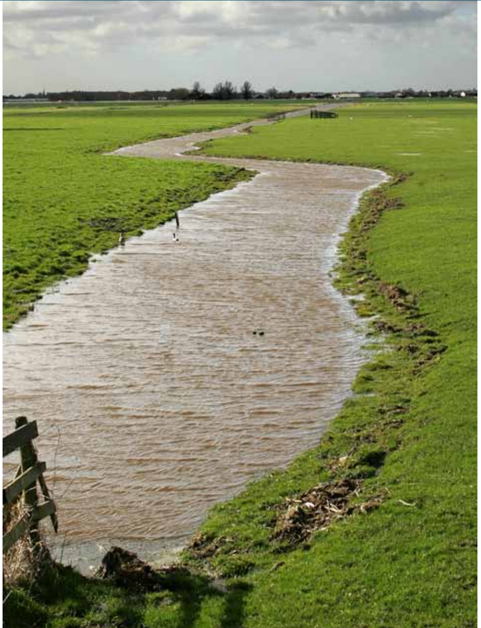
Sloten tellen sinds 2007 niet mee voor het bepalen van de landbouwsubsidie.

De onderzoekers zijn in gesprek met Dienst Regelingen, boerenorganisatie ZLTO en fabrikanten van geo-apparatuur om te zien of er mogelijkheden zijn om boeren zelf meer invloed te geven op de metingen van hun areaal. Janssen: 'Boeren hebben steeds meer GPS-apparatuur op hun machines, en dat zal in de toekomst alleen maar toenemen. Ze hebben