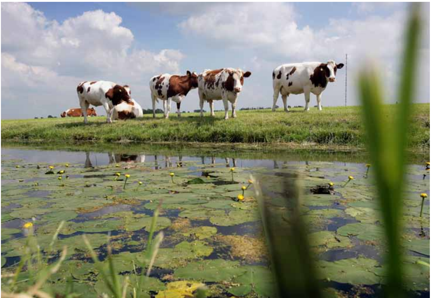
Het Europese Gemeenschappelijk Landbouwbeleid gaat op de schop. Het komende jaar moeten de grote beslissingen worden genomen. Onderzoekers zijn sceptisch over de te verwachten resultaten.