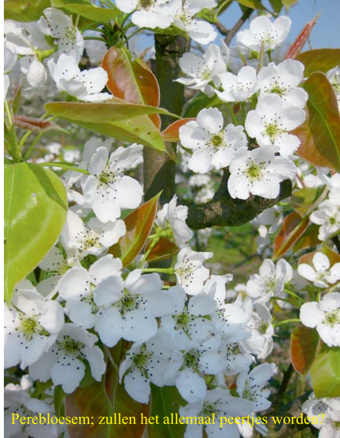
Perebloesem; zullen het allemaal peertjes worden?

Mijn vrouw vraagt zich af of het nog wel goed met me komt.