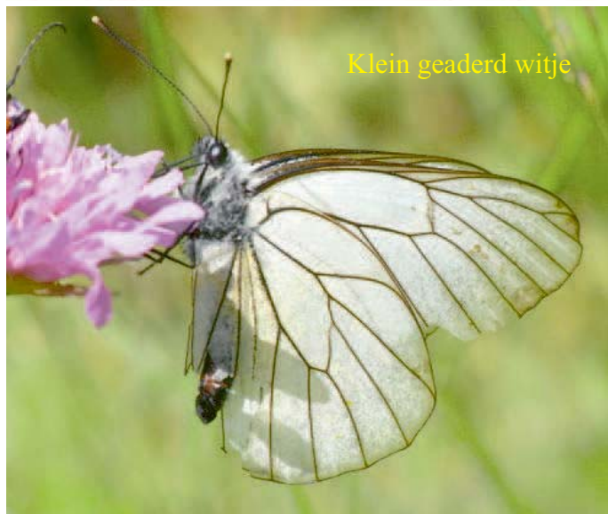
Klein geaderd witje