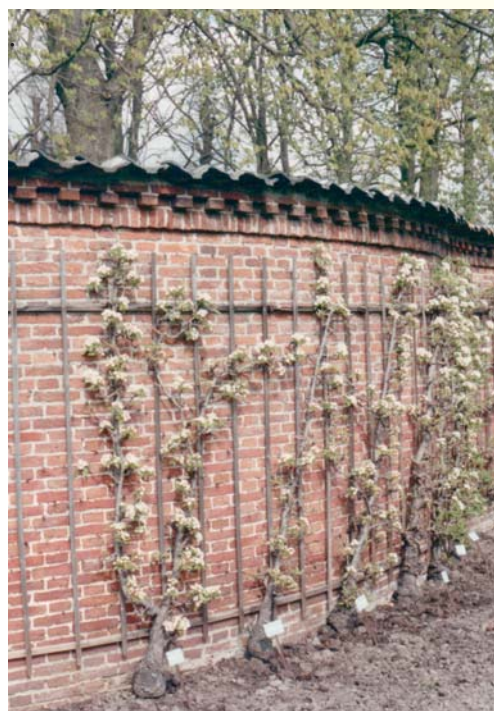
Een detail van de muur met leibomen. Zie hoe een en ander is uitgevoerd

De boom groeit matig sterk en vormt een pyramideachtige kroon.