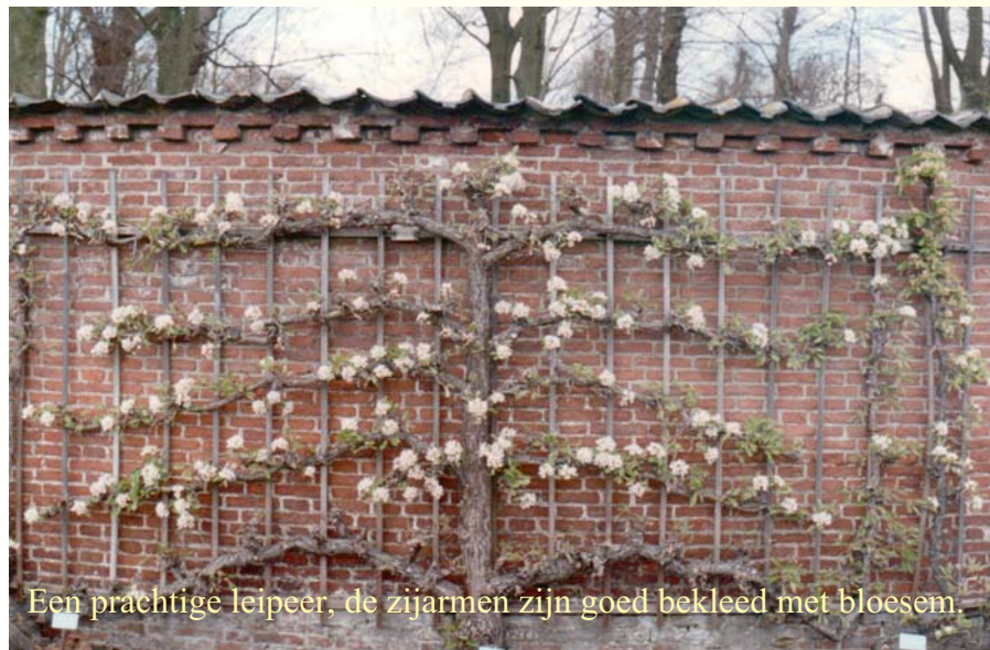
Een prachtige leipeer, de zijarmen zijn goed bekleed met bloesem.

Er zijn onder meer de volgende rassen peer aangeplant.