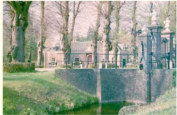
Het Huys te Manpad met de grote poort.

Tegen de slangenmuur staan vele leibomen waarvan de pererassen de dienst uit maken.