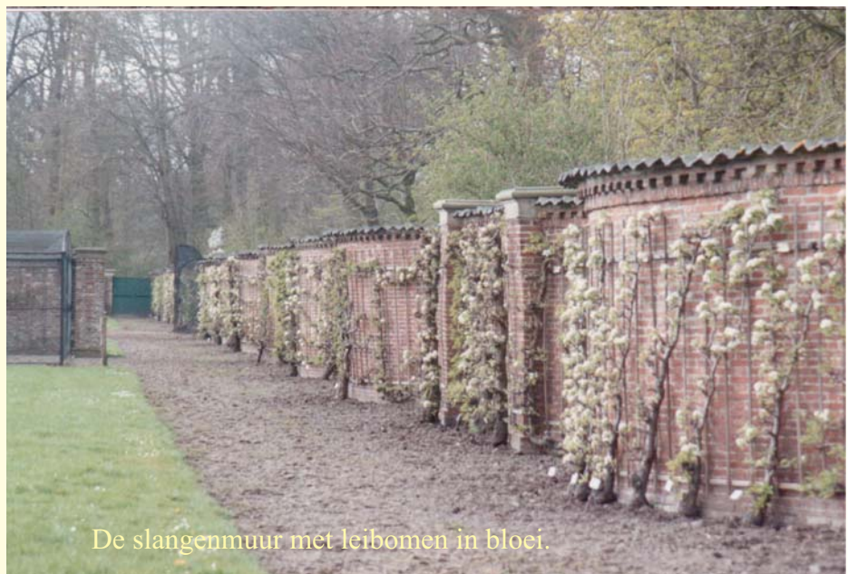
De slangenmuur met leibomen in bloei.