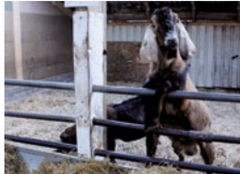
Doel is, vanwege hun aanhankelijke karakter, steeds meer Nubische geiten te krijgen.