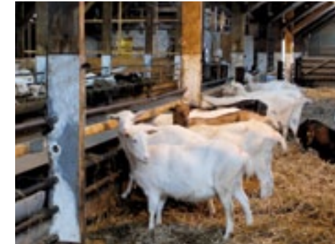
De 70 geiten vertoeven in een ruime stal voorzien van een dikke laag stro.