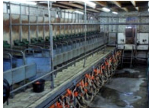
De melkstal wordt nog maar aan één zijde gebruikt, en niet eens volledig.