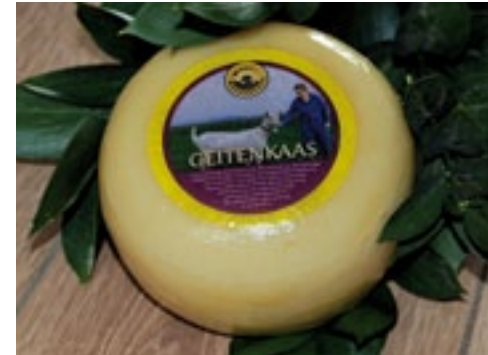
Kaas van Keroazie. Van a tot z gemaakt door mensen met een beperking.