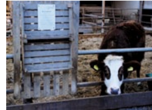
Over het hele bedrijf zijn borden met toelichting te vinden, zoals bij de Blaarkoppen.