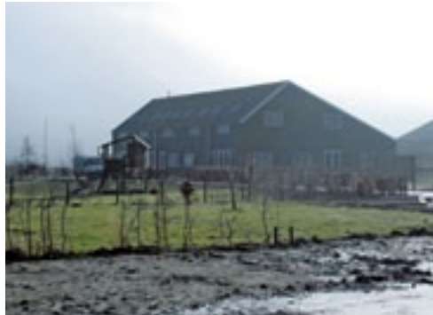
Het appartementencomplex op het erf, waar acht mensen begeleid kunnen wonen.