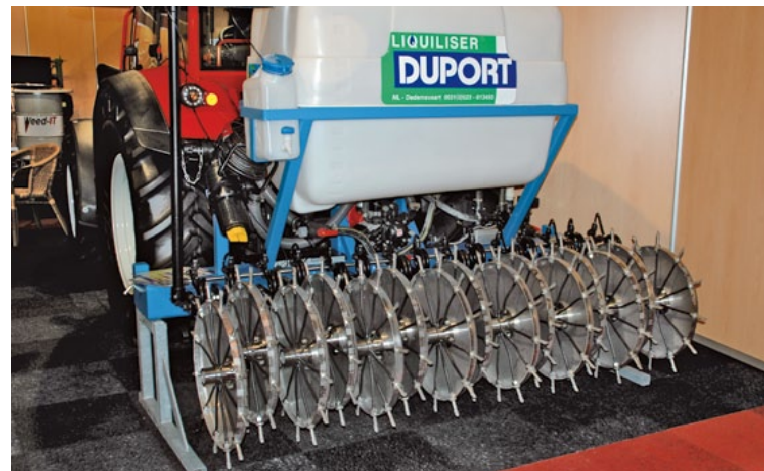
De Liquiliser van Duport in 'turf care' uitvoering voor injectie van vloeibare meststoffen. Ook engerlingen en emelten zijn met de Liquiliser te bestrijden.

viel iedereen op. Een laadvermogen van 2 ton via een 'beweeglijke' derde as is een mooi staaltje technisch vernuft. Dat geldt ook voor de nieuwe hydraulische arm van Becx. Die was in Hardenberg nog zo nieuw dat er geen tijd was geweest om hem van een kleurtje te voorzien. Dat maakte hem dan weer extra spannend. Al met al biedt een beurs als Hardenberg een goede mogelijkheid om nieuws op te snuiven; ook voor het leggen, versterken en/of onderhouden van contacten. ■