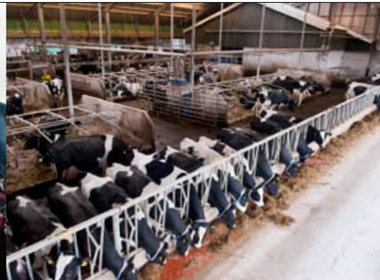
De stal is omgebouwd tot een 2+6 rijige stal