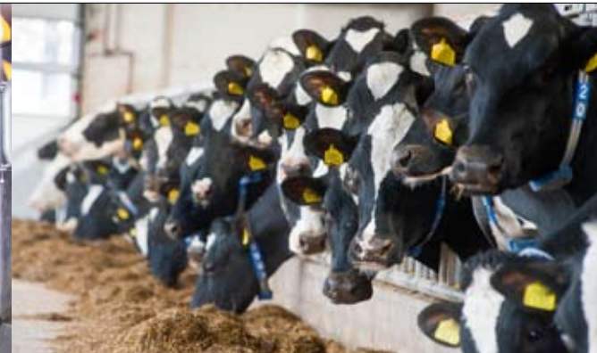
Het rantsoen bevat 55 procent mais

Jan Winter: 'Vaarzen waarvan we verwachtten dat ze geen 100.000 kg halen, verkopen we'