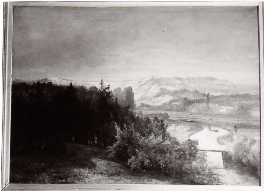
1870, J. Bilders, een zandvaart van Elswout

Bilders heeft in 1870 een groot schilderij gemaakt van een zanderijvaart van Elswout.