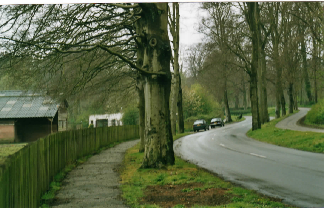
op termijn witte kas weg