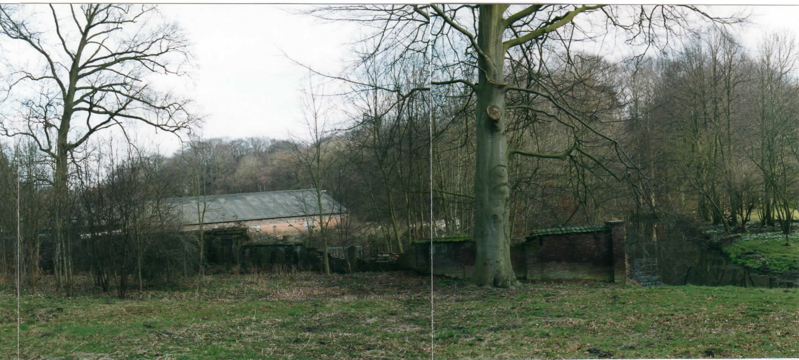
stal wordt afgebroken zicht naar bruine beuk solitair meidoornbosje rechts van water