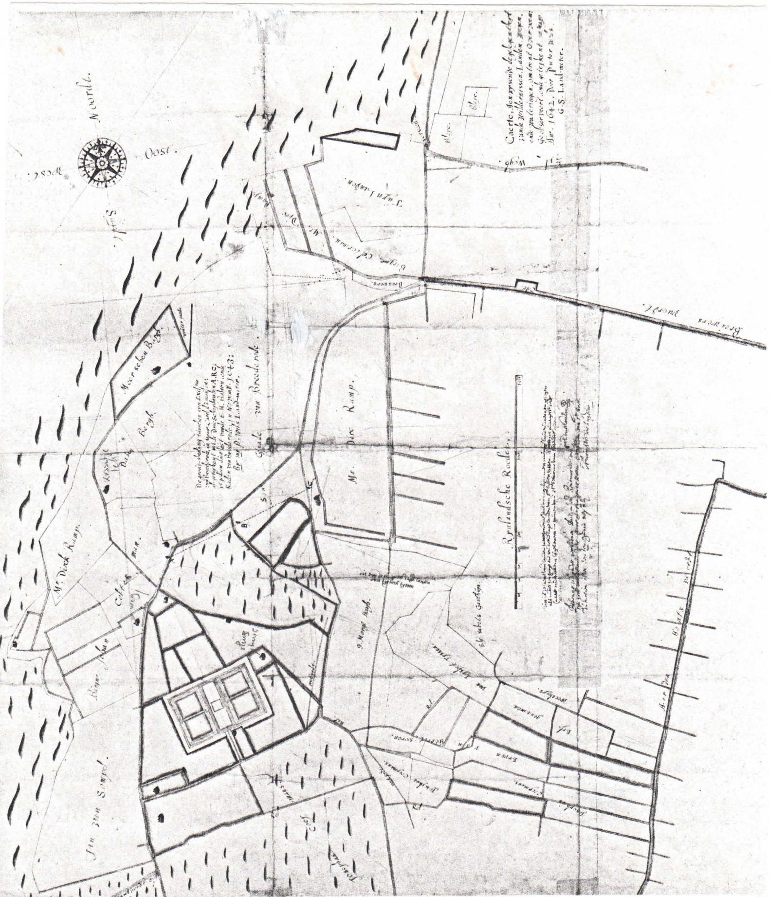
1642, Pieter Wils landmeter, kaart van Elswout en omgeving met deel Duinlustweg, (Meerschenburgh is het latere Duinlust)