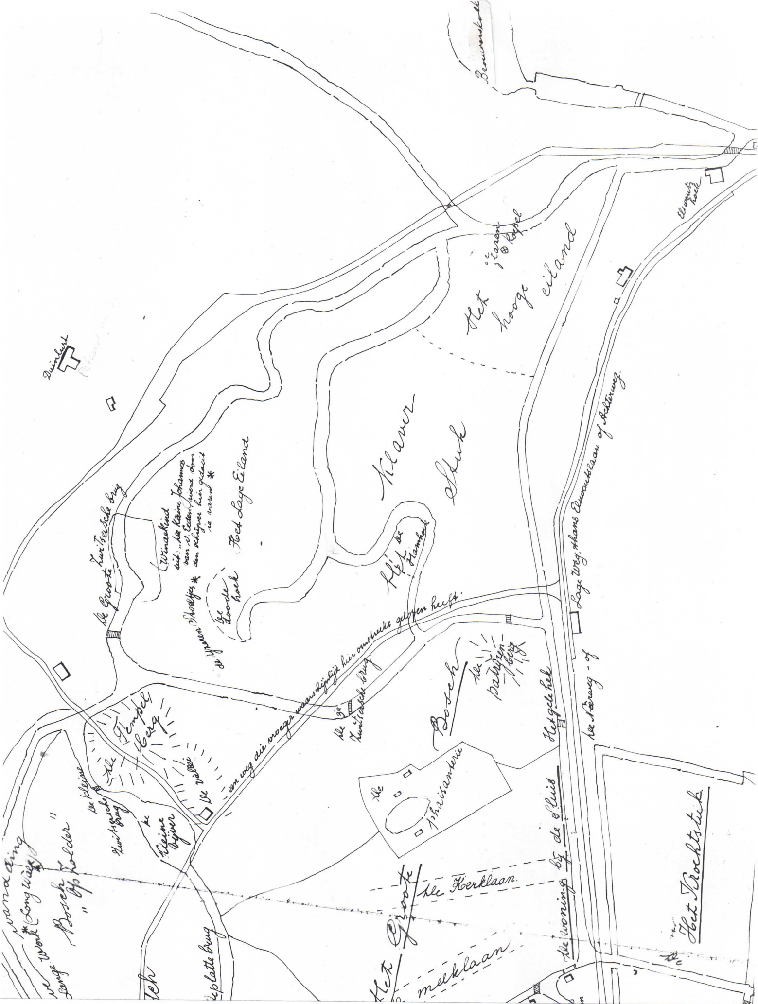
Ca 1860 benamingen van Elswout, archief Elswout, kopie door Publieke Werken Bloemendaal