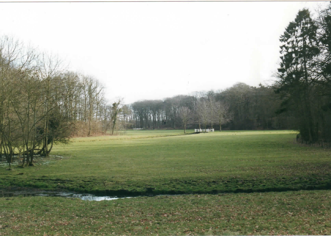
Klaverstuk van Elswout