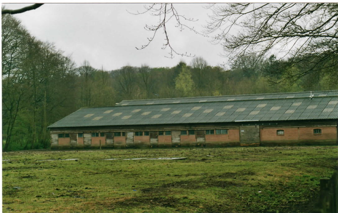
stal wordt afgebroken en bomen verwijderd, zodat doorzicht naar het Klaverstuk ontstaat