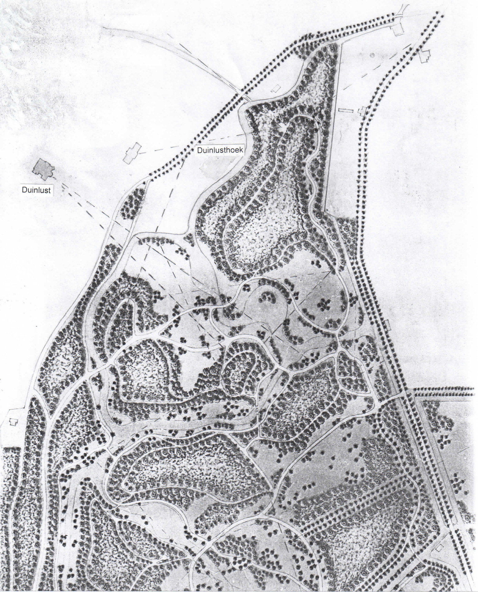
1883 E.C.A. Petzold, plan voor Elswout (detail)