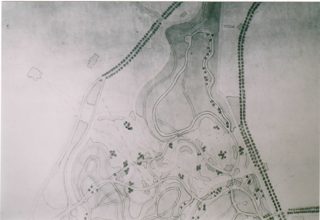
1883 Schetsplan voor Elswout door Petzold, deels bestaande situatie, deels ontwerp

1975 Staatsbosbeheer, Overzichtkaart Middenduin-Elswout, schaal 1: 5000