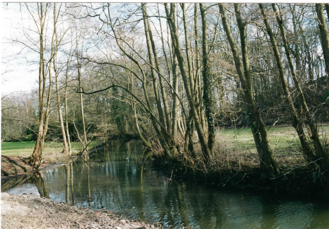
Opslag van elzen langs de zanderijvaart; rechts het Hoge Eiland

De hele omgeving Klaverstuk, Duinlusthoek en Duinlust kan in principe hersteld en in zijn historische context onderhouden worden, terwijl de functie voor natuur en recreatie groter wordt.