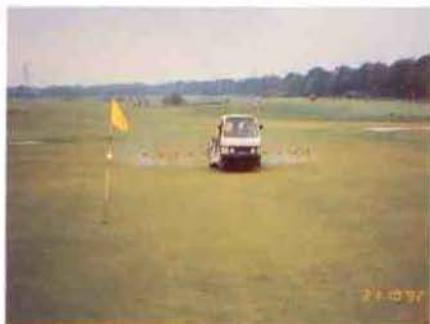
Bestrijdingsmiddelen, een apart aandachtspunt!