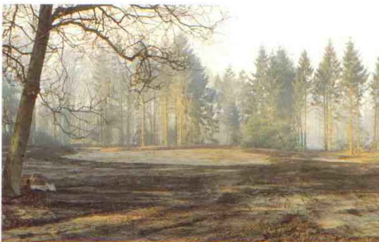
Geprofileerde onderbouw van green 10, voor drainag