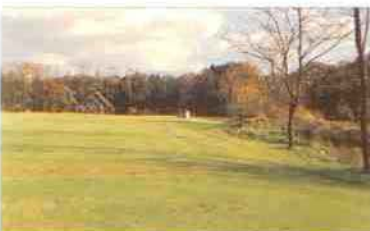
Geprofileerde top laag op green 8, markeringen ter plaatse van sproeiers

Bij de aanleg van 't Sybrook zijn de voor Nederland meest gebruikelijke oplossingen gekozen. Zo zijn greens opgebouwd uit een top laag van 20 cm. op 30 cm. drainagelaag.