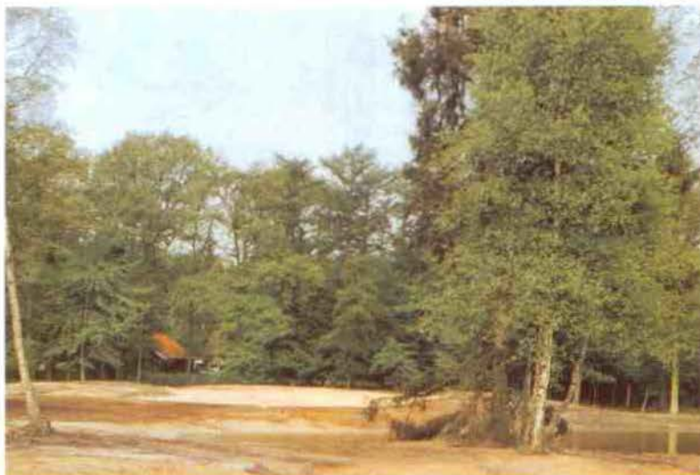
Vijverpartij en de onderbouw van green 14

Voor het gras dat vrijkomt bij het maaien van de greens en de tees heeft van Heek speciale karren laten maken die achter een greensmaaier te koppelen zijn. Achter de greenkeepershal is een verzamelbak waar de karren leeggekiept kunnen worden. Van Heek heeft de karren voor ca. fl. 1500,- bij een plaatselijk bedrijf laten maken.