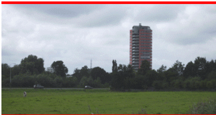
Geen eenheid tussen gebouw en omgeving, maar wel veel mensen op een klein oppervlak die van de omgeving genieten...

Interessant was ook de conclusie dat we met bebouwing de hoogte in moeten om het landschap zoveel mogelijk te sparen. Op de vraag of men dan ook in een flat wilde wonen, werd echter terughoudend gereageerd. Daar was weinig enthousiasme voor. Er bleken ook weinig deelnemers in een flat te wonen.