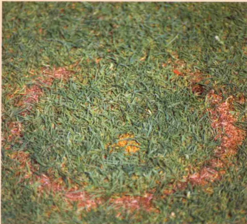
Tijdens het Open worden de randen van de holes wit geschilderd. Met als gevolg dat de buitenste rand van de hole afsterft. Let ook op de gele stip midden op de foto. De PGA zet iedere dag na de wedstrijd een stip op de green als aanduiding voor de pinpositie. De greenkeepers moeten dan 's ochtends op exact die positie een hole steken.

Wat wij binnenkort willen doen is het voorstellen van de greenkeepers en de machines aan de spelers. Wij zetten alle machines voor het clubhuis en dan kunnen spelers vragen stellen".