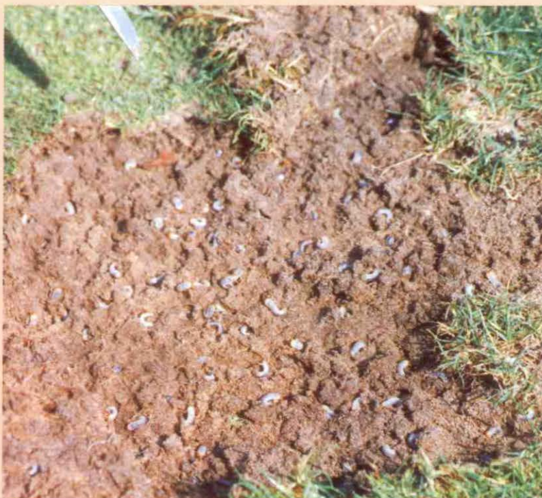
De Hilversumsche Golf heeft de laatste jaren vrij veel last gehad van Engorlingen.

Meestal worden die bestreden door de aangepaste plekken opnieuw te bezoden maar eerst wal Dursbankkorrels door de top-laag te werken. Schalk: "Op die manier hoef je de baan niet 5 dagen dicht te houden en je bent toch van het probleem af".