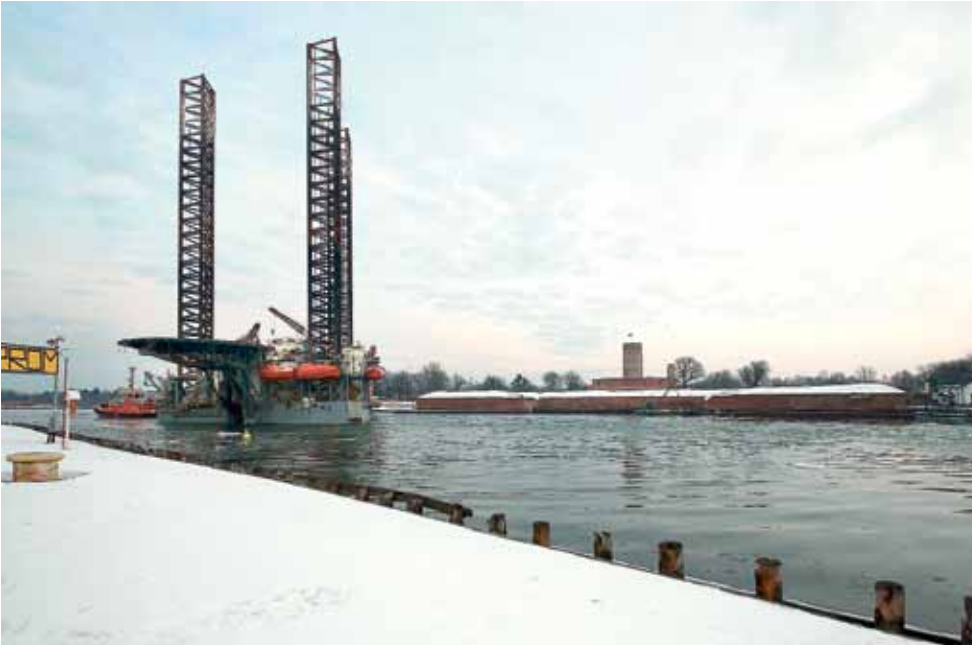
Zonder baggerwerk zullen vaargeulen dichtslibben en kunnen bulk-carriers niet langer de Eemshaven bereiken om daar kolen aan te voeren.