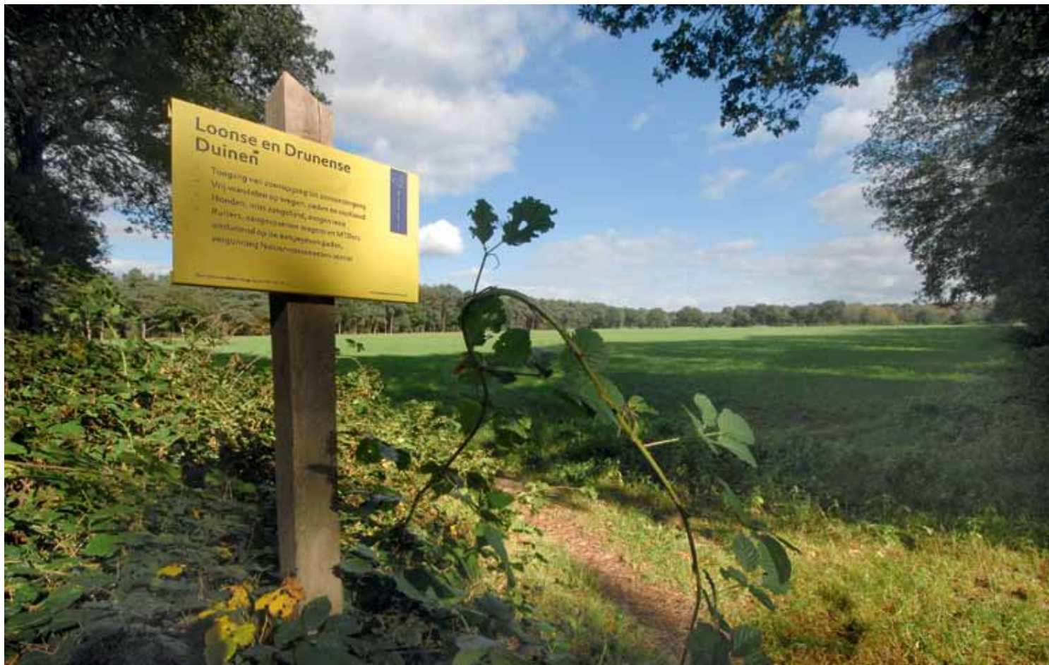
De Loonse en Drunense Duinen kampen met een grote recreatiedruk. Hoewel de echte drukte tot de randen van dit grote natuurgebied beperkt blijft, lijkt er toch verstoring op te treden.

Naast dat landsdekkende beeld bleek er ook behoefte aan een meer gedetailleerde uitwerking van de kijkrichtingen in een aantal bestaande natuurgebieden. Dat zou namelijk laten zien hoe de kijkrichtingen in de praktijk uitwerken en wat de meerwaarde van echt kiezen zou kunnen zijn. We hebben de kijkrichtingen uitgewerkt voor de Grevelingen, de Loonse en Drunense Duinen en het Eems-Dollard estuarium. Naast de conclusies die we over de afzonderlijke gebieden trokken konden we ook enkele meer algemene conclusies trekken. Die komen in dit artikel aan bod.