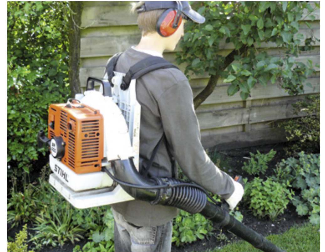
Stel voordat je gaat werken de draagbanden goed af. Deze tijdsinvestering verdient zich zeker terug.

zeker af te raden. Ook een bladblazer heeft een antivibratiesysteem. Deze veren voorkomen dat de schadelijke trillingen de persoon bereiken. Kijk periodiek of deze veren in goede staat zijn en nog vast zitten. Ook is het werken op een talud bij een sloot een aandachtspunt. Zwemmen met een bladblazer op de rug blijft lastig. Het is zeker handig om vooraf na te gaan hoe je de blazer snel van de rug kunt nemen, ook wanneer bijvoorbeeld een wespennest geraakt is. Met aandacht voor deze verschillende kleine punten is het blijvend plezierig werken met de bladblazer. ■