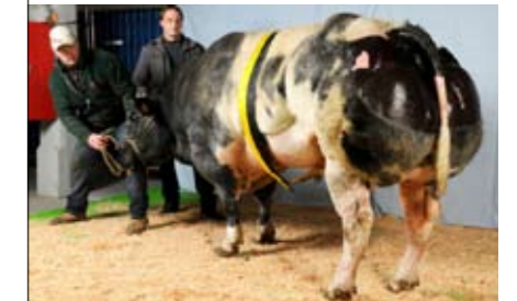
Nestlé de St. Fontaine (v. Etna), kampioen oudere stieren