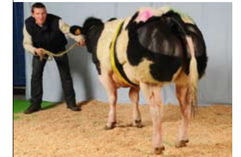
Nevralgie de Fooz (v. Germinal), kampioene jonge vaarzen