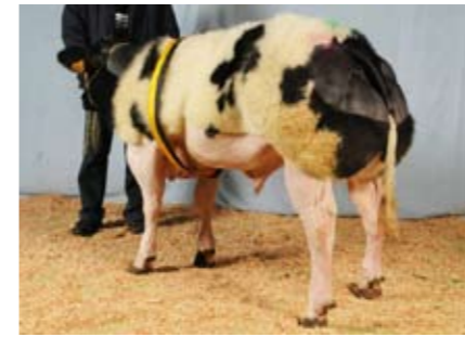
Gordon (v. Impartial), kampioen stierkalveren

En een ongelukje komt nooit alleen, is een gezegde. Zo ook te Affligem. De vierkoppige jury opereerde vanaf de start met aarzelingen en onzekerheid. Het zorgde voor verhitte gemoederen bij sommige deelnemers. Zoals in de rubriek met jonge jaarlingstieren waar