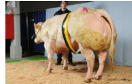
Frontman v.d. Kerkenhofstede (v. Can. Club), kampioen stieren middengroep