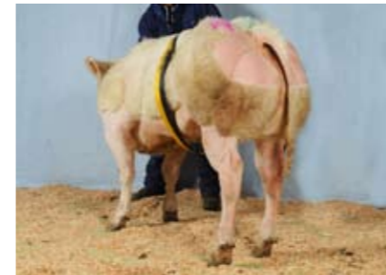
Gravin van het Kruisborre (v. Heroïque), kampioene vaarskalveren